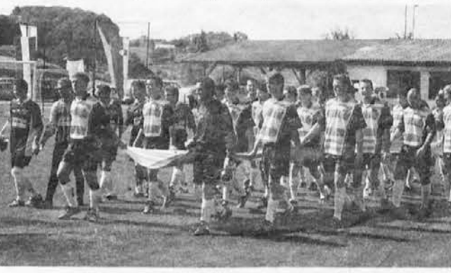
Vhod na igrišče pred tekmo proti Franciji

(2) V zadnji številki Svobodne Slovenije smo že poročali o naši turneji po Sloveniji. Bili smo že v Šenčurju in v Slovenj Gradcu. Naslednje prizorišče je bilo v Jareninah, še naprej od Maribora. Druga ekipa v naši