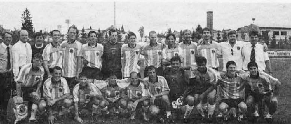
Slikanje pred tekmo proti Koprju.