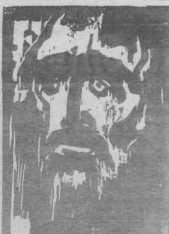
Emil Nolde: Pevski. 1912