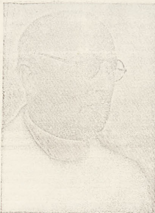
„Niste več sami!“

manjšem obsegu posebnih akcij, ki jih naj podpro moralno in gmotno, le mi še nikoli. Že samo to dejstvo je naša radost in naš ponos. Naši napor, prikazati slovenski javnosti naš beden položaj in opozoriti na nevarnosti, v katerih neprestano živimo, posebno naša mladina, niso zaman. Led je prebit, sonce živahnega narodnega dela ga je predrlo in odslej bo toliko bolj ogrevala ljubezen celokupnega slovenskega naroda rojake, živeče na Kočevskem. Kdor je enkrat videl našo osamelost, zapuščenost, v kateri živimo med tuje-