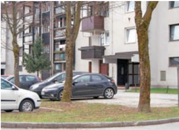
Problem parkiranja v Preski je velik. Pred blokovi parkirnih mest primanjkuje in stanovalci so v parkirišče preuredili celo zelenico.