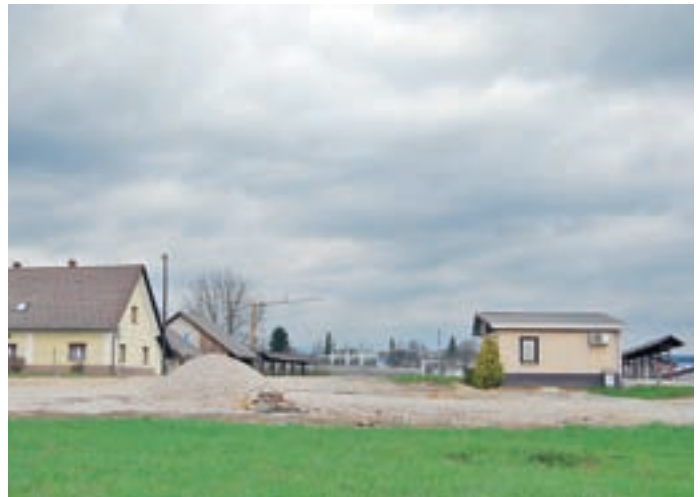
Občina bo pri pokopališču uredila parkirišče z okrog petdesetimi parkirnimi mesti, ki bodo namenjeni obiskovalcem pokopališča.