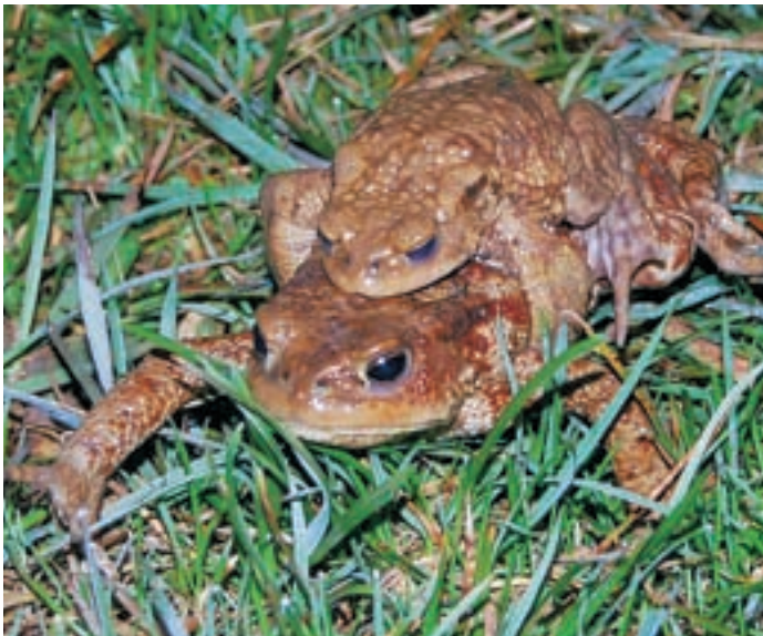
Pogost prizor, ko samica nese enega ali celo več samcev.