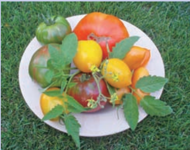
Pisan krožnik s petimi različnimi vrstami paradižnika je popestritev vsake poletne solate.

Zagotovo bomo našli veliko zelenjave v vijolični barvi. To bomo dobili s pomočjo vijoličnega kodrolistnatega ohrovtva, ki je dokaj neznan zelenjava, a zelo bogata z vitamini. Poleg ohrovtva ima vijolične liste še zelje, temnolistna grmasta bazilika in žajbelj. Niso pa atraktivni le vijolični listi, temveč tudi vijolični plodovi naslednjih rastlin: visok fižol, cvetača, korenje, paprika, paradižnik, jajčevci, krompir, brstični ohrovt. Poleg vijolične barve lahko v vrt posadimo tudi druge vrste rastlin z zanimivimi barvami in oblikami plodov.