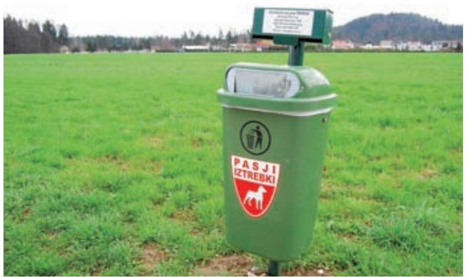
Največ koškov za pasje iztrebke je postavljenih v središču Medvod in v Preski.

Kot je dejal, se je novost kar prijetila in koški se polnijo. "So pa tudi takšni, o čemer smo se