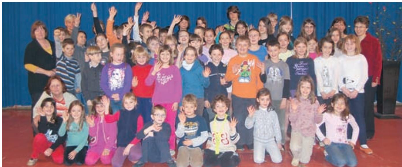
Dobitniki bronastih Vegovih priznanj na OŠ Pirniče z mentoricami