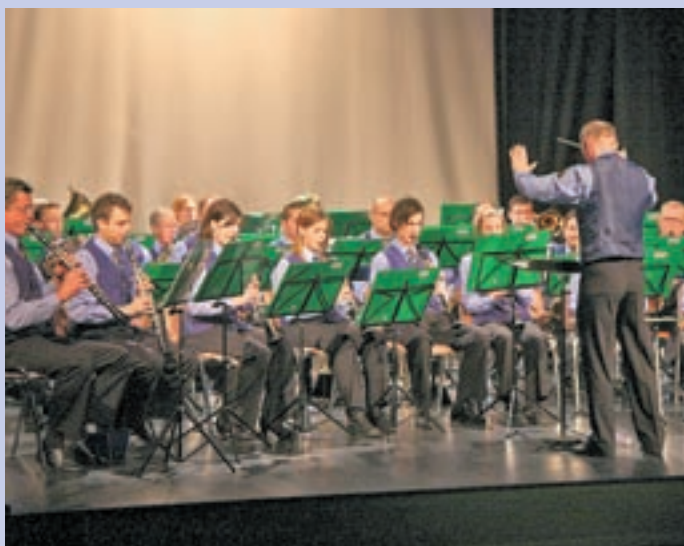
Medvoški godbeniki so se marca predstavili na pomladnem koncertu, aprila pa jim boste lahko prisluhnil na Večeru filmske glasbe.