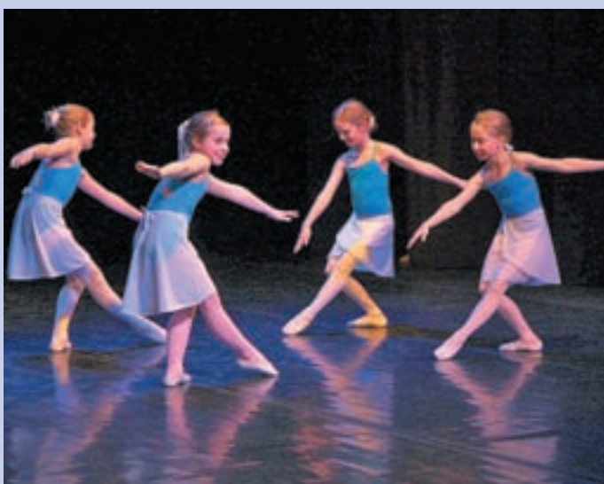
Mladi baletniki so tudi tokrat navdušili občinstvo.