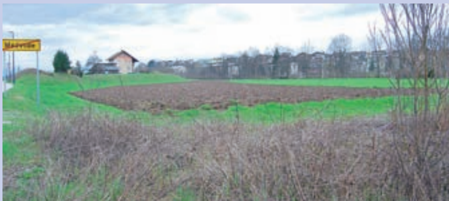
Na območju od propadajoče športne dvorane proti Goričanam je predvideno tudi nogometno igrišče.

Dvoranska sezona se torej zaključuje, medvoški igralci tenisa pa se z 20. aprilom selijo na zunanja peščena igrišča ob železnici, kjer bodo trenirali do jeseni. Balon bodo znova postavili v začetku oktobra. Maja Bertoncej