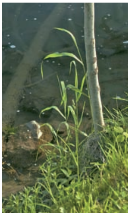
Ena izmed razstavljenih fotografij