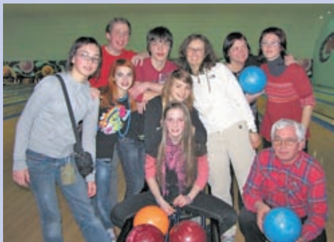
Učenci in učitelji OŠ Medvode so se preizkusili tudi v bowlingu.

Angleški učenci so tujim gostom predstavili tudi vas Ickford s šeststo prebivalci, ki ima poleg šole še trgovino, cerkev in angleški pub, zanimivo pa je, da so se domačini zavestno odpovedali javni razsvet-