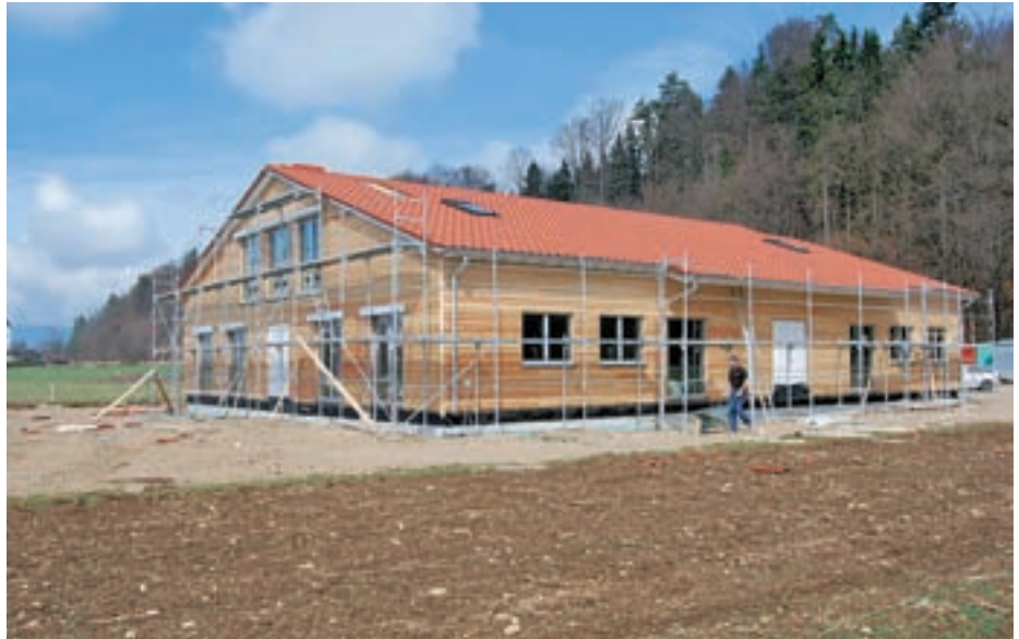
Montažni objekt so postavili v enem tednu. Nova ekipa (električarji) pride prihodnji teden.