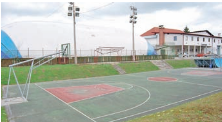
Balon bo stal še do maja, znova pa ga bodo postavili oktobra.

če se bo bližal kakšen turnir na trdi podlagi. Na njem se bo lahko igral tudi nogomet, za ostale športe pa ta podlaga ni primerna. Igrišče bo potrebno ograditi, njegova uporaba pa bo dovoljena ob predhodni rezervaciji."