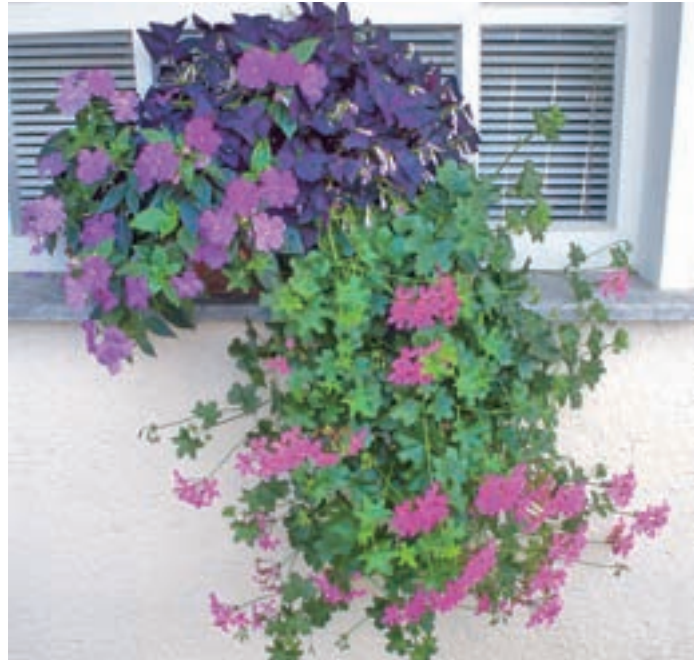
Nezahtevna zasaditev v moderni vijolični barvi na poldnevni legi. Sestavljajo jo bršljanke, viseča vodenka in temnolistna deteljica, ki so posajene v glineno korito.