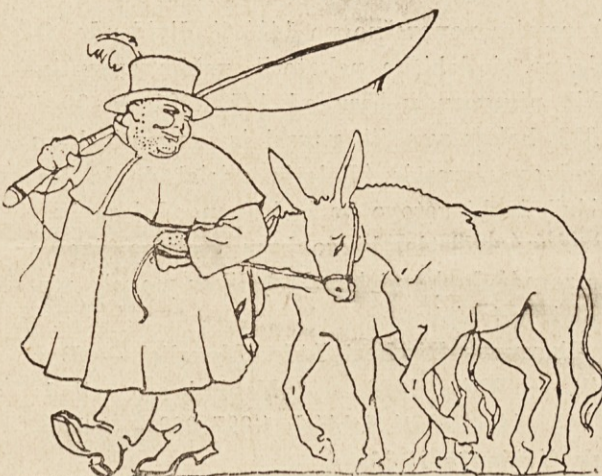
Oba nova osla, Storžka i Kodeljo, je odpeljal voznik na živinski semenj, kjer ju je dobro prodal

Zdaj veste, dragi moji mali braveci, kako lepo po obrt je izvrševal voznik? Ta grdi podlež, ki ga je bilo v obraz sam med in mleko, je vozaril po svetu in spotoma zbiral z sladkimi obljubami in dobrikanjem zbirane otroke, ki jim niso dišale knjige in šola, in ko jih je naložil na voz, jih je odpeljal v Igriško, da bi zabili ves svoj čas v igre, burke in druge zabave. Ko pa so ubogi, omamljeni otroci, ki so se samo igrali in nikdar nič učili, postali pravi osli, se jih je voznik vesel in zadovoljen polastil in jih odvedel prodajat na tržišča in sejmišča. Ln tako si je nabral v par letih toliko evenka, da je postal milijonar.