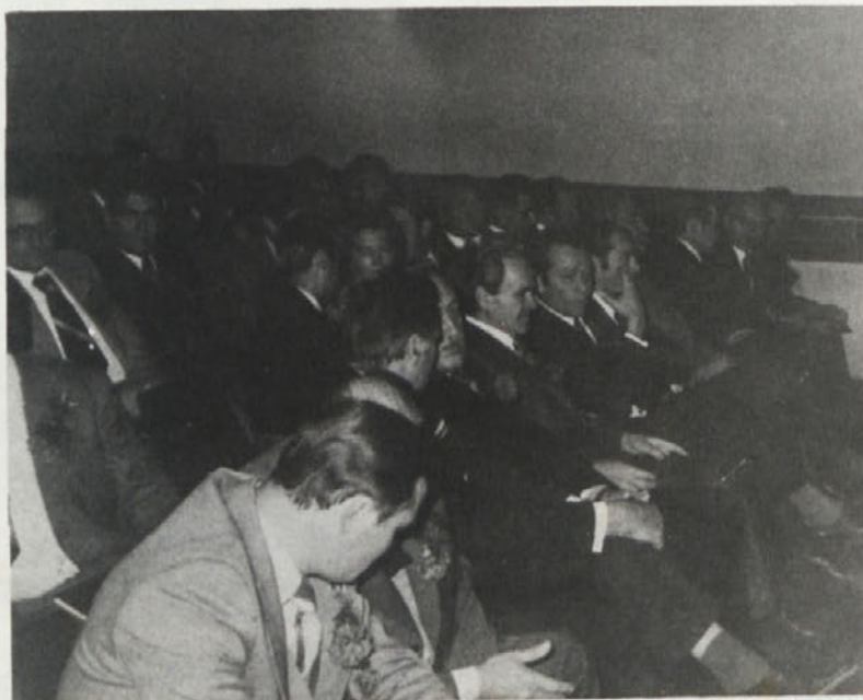
Pogled na častne goste, ki so se udeležili slavnosti ob 30-letnici SGP PIONIR, novembra lani v Domu ljudske prosvete v Novem mestu

Po 1. juliju 1977 torej ne bo več možno izplačevati terenskega dodatka precejšnjemu številu delavcev v naši delovni organizaciji, saj se bo lahko izplačeval le delavcem, ki bodo delali zunaj kraja, kjer je njihova TOZD in izven kraja stalnega oziroma začasnega bivališča. Sindikalna lista določa, da se terenski dodatek izplačuje pod pogojem, da delavec dela zunaj kraja sedeža organizacije združenega dela in zunaj svojega stalnega oziroma začasnega bivališča, ni pa določeno, da bi moral delavec delati in prebivati zunaj teh krajev. Zaradi pravno nedorečene formulacije upravičenosti do terenskega dodatka v Sindikalni listi, bo to vprašanje potrebno precizno in enotno urediti v našem panožnem samoupravnem sporazumu. Kot že povedano, sem mnenja, da Sindikalna lista nima namena ukinjati terenski dodatek v gradbeništvu, če pa bi se to vendarle zgodilo, se pojavlja vprašanje dodatka za ločeno življenje, ki v Sindikalni listi tudi ni ustrezno urejen. Po veljavnih določbah se izplačuje dodatek za ločeno življenje tistim delavcem, ki niso upravičeni do terenskega dodatka, vendar živijo ločeno od svojih družin zaradi dela. Dodatek za ločeno življenje je prenizek v primeru da bi delavcem v gradbeništvu odpadel terenski dodatek, saj znaša mesečno največ do 1.425 din, poleg tega bo treba rešiti tudi vprašanje, kako z nadomestilom za ločeno življenje tistih delavcev, ki pridejo na delo iz drugih republik in imajo tam svoje družine.