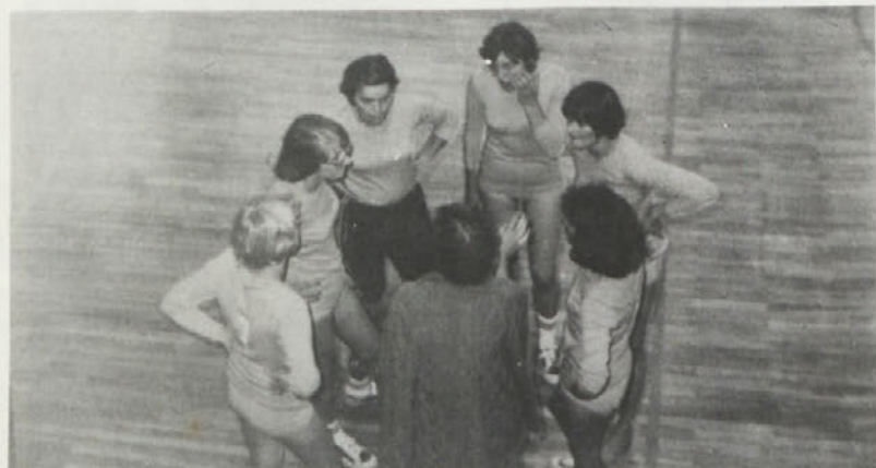
PIONIRJEVE ženske odbojkarice na finalu ŠIG 76 v Kranju med enim izmed time-autov

Novo sprejetim in tistim, ki so se vrnili iz JLA želimo dobro počutje ter veliko delovnih uspehov, tistim, ki so odšli v JLA, da bi jim rok čimprej minil, tovarišici, ki je odšla v pokoj veliko zdravja in zadovoljstva.