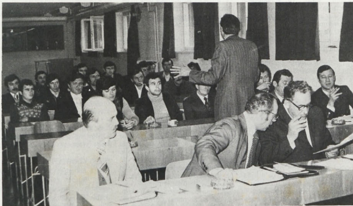
Kot ena prvih je bila 15. januarja skupščina Sindikalne organizacije TOZD Gradbeni sektor Novo mesto. Izvršne odbore SO, ki so že imele skupščino, prosimo, naj pošljejo BILTENU najpozneje do 30. januarja kratka poročila o tem, kako je njihova skupščina potekala in o čem so največ govorili na njej