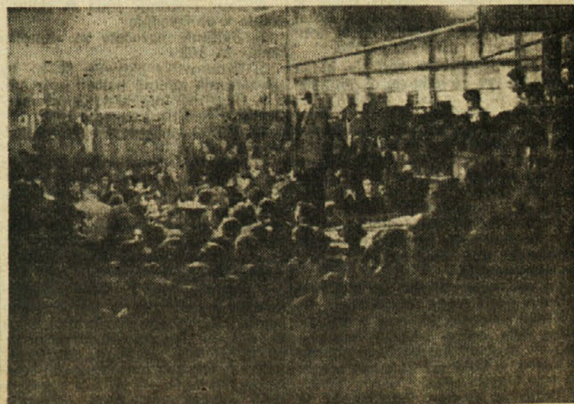
Slavnostno zborovanje v steklarni

Tudi racionalizatorja Velej Jože in Velej Tone sta med njimi. Velej Jože je poleg ostalega dela izboljšal polavtomatski univerzalni stroj, s katerim je že pred nekaj meseci povečal proizvodnjo kozarcev. V novembru je dovršil nov model za izdelovanje manjših predmetov. Preuredil je tudi stroj za vsesavanje zraka za motor in s tem olajšal delavcem delo. Njegov brat Velej Tone je izpopolnil hladilno peč, tako, da je iz stare naredil po lastni zamisli popolnoma novo in