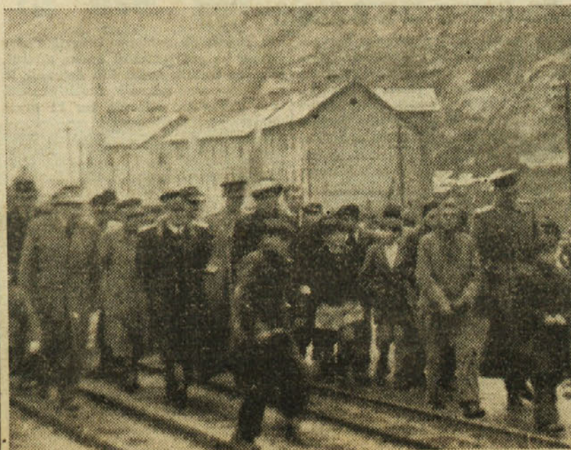
Obisk maršala Tita, pomemben dan za revirje

manjka. So pa tudi taki primeri, da tiste tovarne, ki proizvajajo življenjske potrebščine, nimajo dovolj surovin. V naši državi še nimamo dovolj surovin, n. pr. za proizvodnjo tekstilij, bombaž in volno pa moramo kupovati v drugih državah, za zelo visoke cene.