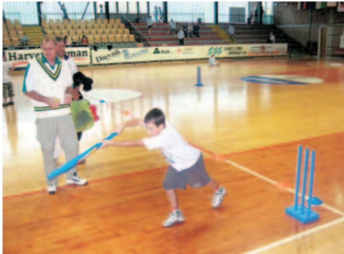
Odbijalec skuša čim bolje zadeti žogo in narediti čim več tekov.