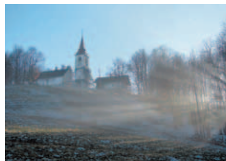
3. mesto: Boris Galičič