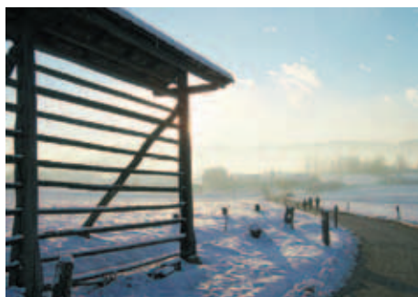
1. mesto: Gregor Meglič