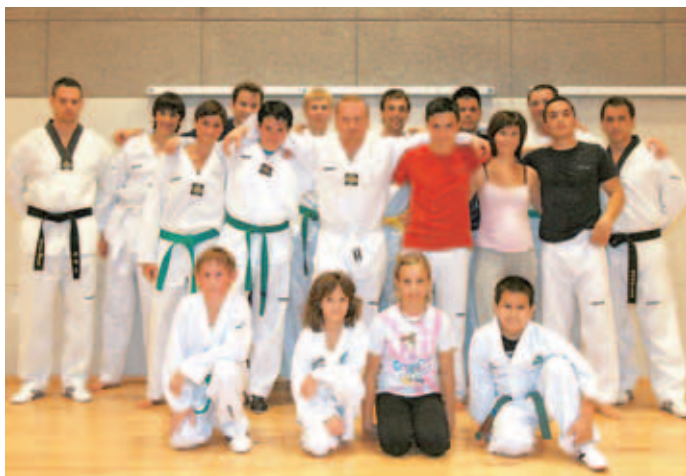
Člani Taekwondo kluba Medvode