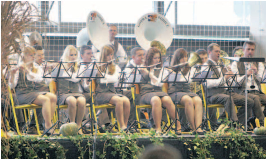
S svojim programom so se predstavili tudi godbeniki iz Vodice.