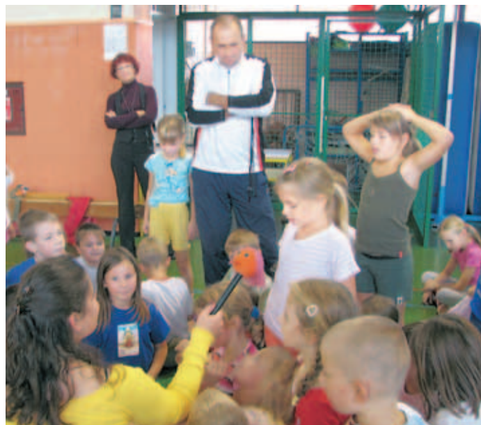
Tudi mlajši učenci so bili pred kamero zgovorni.

letko v Sloveniji, velik poudarek namenjamo vzgojnemu delovanju in razvijanju pozitivne samopodobe. Skoraj vsak razred peljemo vsaj za dva dneva od doma, da se učenci navajajo na samostojnost in odgovornost. Pred dvema letoma smo pripravili dobrodelni koncert za zbiranje sredstev za postavitev vodnjaka v Malaviju ..., je Bizantova našela nekaj zanimivosti, ki jih je izpostavila tudi v oddaji Šport špas, ki je bila na sporedu 19. oktobra.