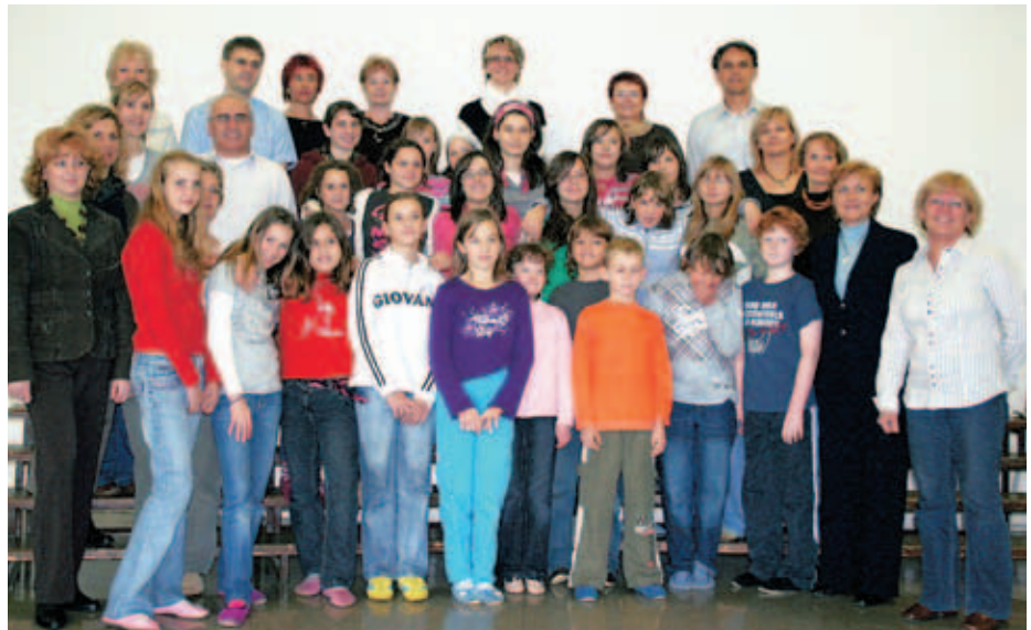
Učenci in učitelji iz Preske skupaj z gosti iz tujih držav

Kljub raznolikostim med državami in jezikovnim preprekam so se med otroki spletle prave prijateljske vezi. "S tem projektom sem dobil precej novih prijateljev in spoznal nekatere značilnosti tujih držav," nam je zaupal pe-