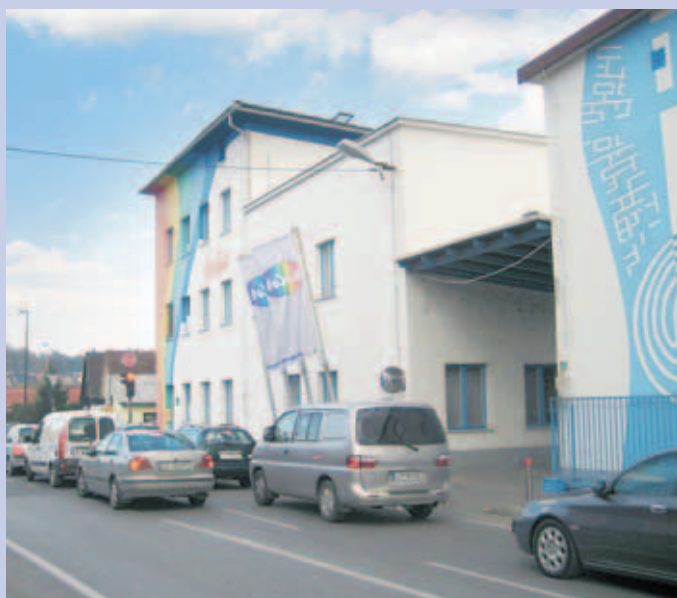
Na mestu sedanjega območja Colorja bodo zgradili sodoben stanovanjsko-poslovni objekt.

Medvode - Družba Color je letos prodala svoje nepremičnine v središču Medvod in na tem območju bo kupec zgradil nov stanovanjsko-poslovni objekt. Nepremičnine Colorja je kupilo podjetje MTB,