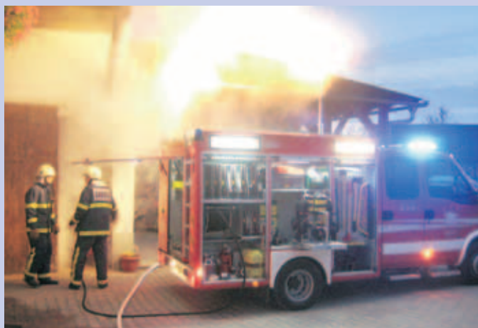
Zagorelo je v garaži s kmetijsko mehanizacijo na kmetiji pr' Šetinc. K sreči le za vajo.

Vajo si je ogledalo kar veliko ljudi. Na kraju intervencije je bil tudi Leopold Knez , poveljnik civilne zaščite občine Medvode in požupan občine, zadolžen za področje zaščite in reševanja, ki je ob tem dejal: "Oktober je mesec požarne varnosti in to je ena večjih letošnjih vaj v občini. Če bi prišlo do požara v vasi Zbilje, bi bila situacija izredno težka, ker je velika gostota hiš in z vozili ne bi mogli priti tako blizu.