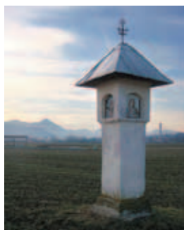
2. mesto: Gregor Meglič