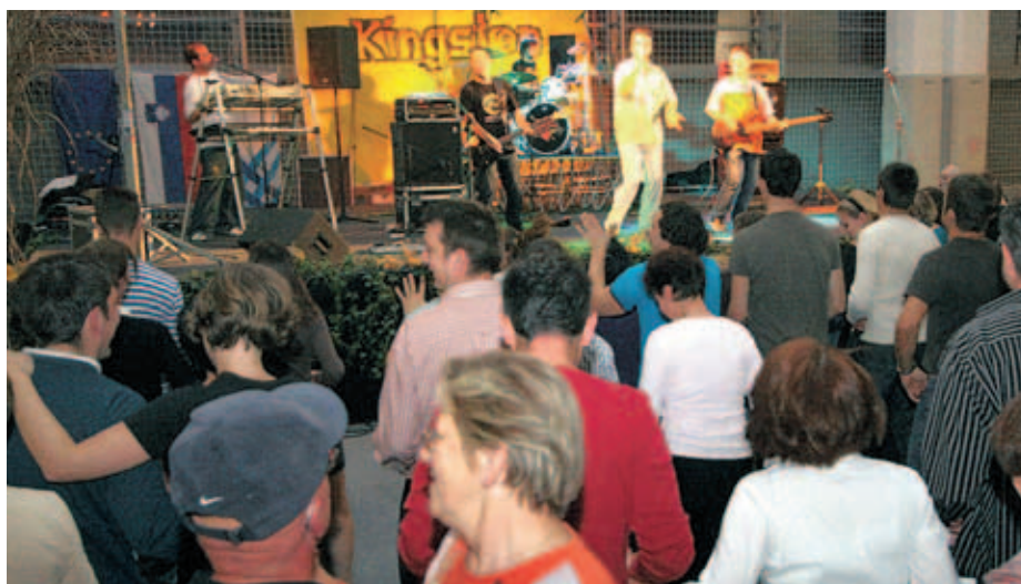
Veselo martinovanje v športni dvorani