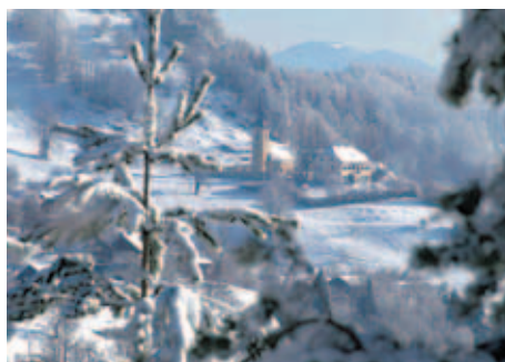
2. mesto: Ciril Sušnik