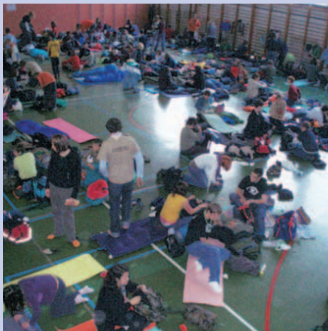
Taborniki iz vse Slovenije so napolnili dvorano v preški šoli.