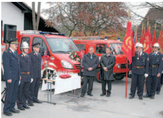
Slovesnost ob prevzemu novega gasilskega vozila v Zbiljah.