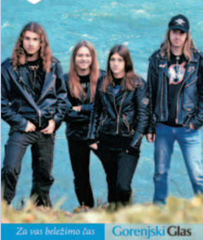
Za vas beležimo čas Gorenjski Glas

Na naslovnici: Glasbena skupina Metalsteel