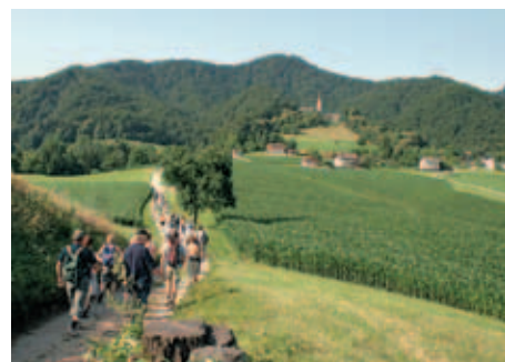
3. mesto: Jože Ločniškar