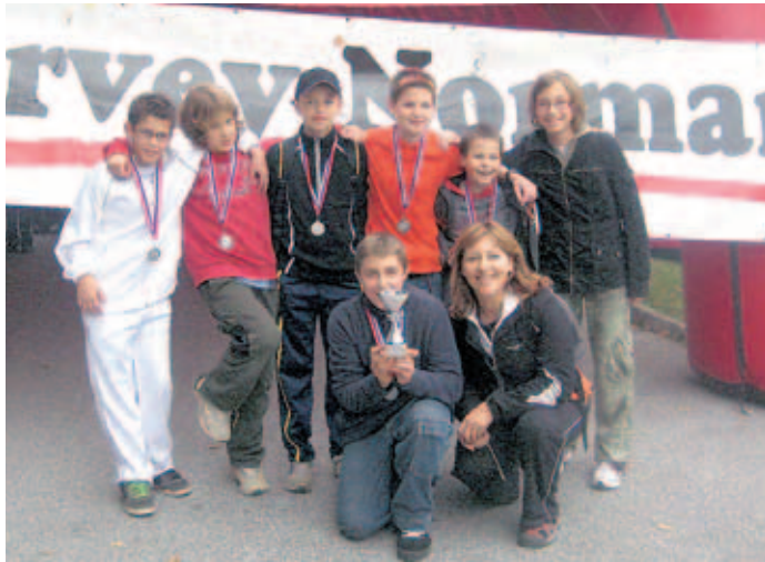
Učenci iz Smlednika se lahko pohvalijo z drugim mestom na odprtem prvenstvu Ljubljane v kriketu.