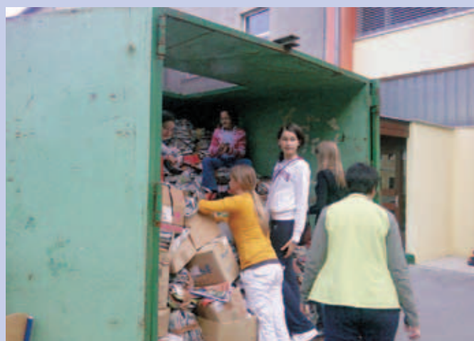
Zbiranje papirja na OŠ Preska