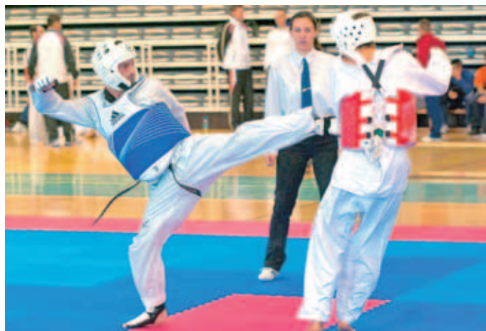
Borba z državnega prvenstva, ki je letos drugo leto zapored potekalo v Športni dvorani Medvode. Šteje udarec z nogo v telo ali v glavo.