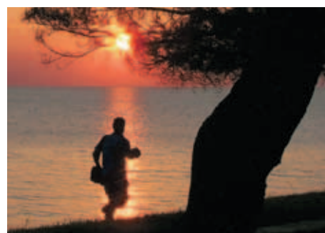
3. mesto: Matevž Jekler