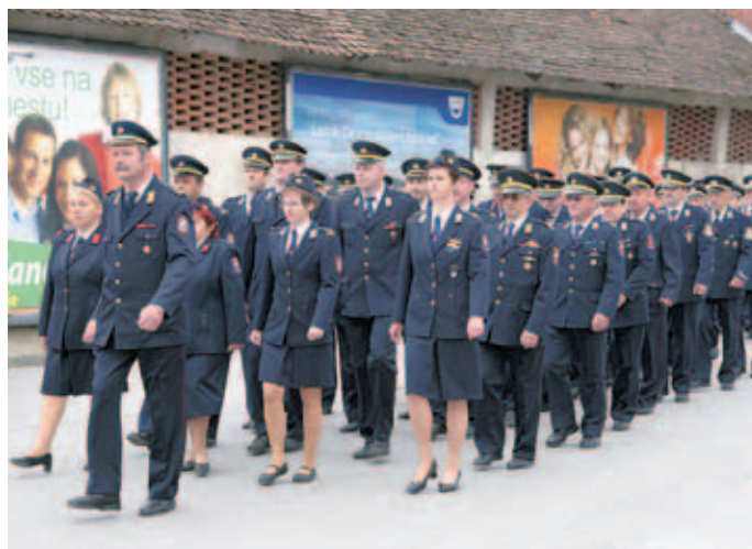
Na slavnostni dogodek so prišli gasilci iz vseh medvoških društev.