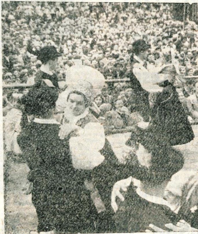
Veselje na kravjem balu