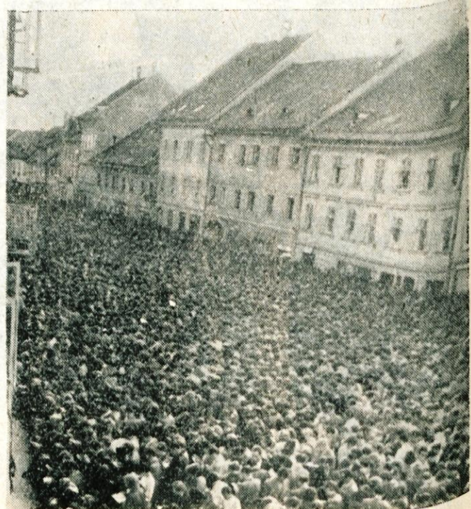
Mravlišče na Titovem trgu v Kranju