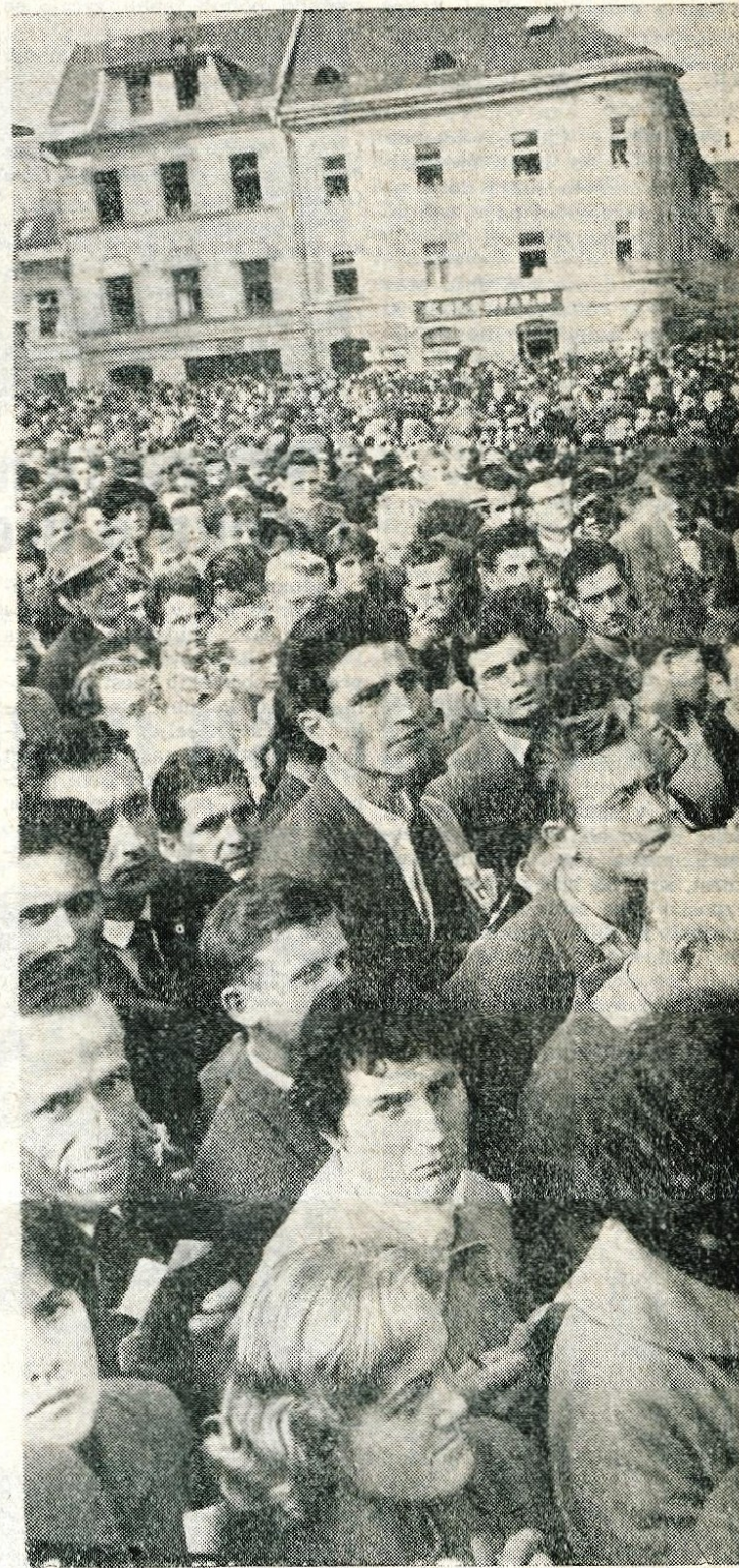
Včeraj na tomboli v Kranju

LESCE, 25. septembra — Danes je bila tu v Almiri majhna svečanost. Najprej je bila ob 15. uri slavnostna seja upravnega odbora tovarne pletenin »Almira« iz Radovljice, nato pa so spustili ob 16. uri v pogon novo barvarno v obratu v Lescah. Slavnosti so se med drugim udeležili tudi številni ugledni gostje iz kranjskega okraja in radovljiške občine, kot tudi nekateri predstavniki drugih tekstilnih tovarn iz Slovenije.