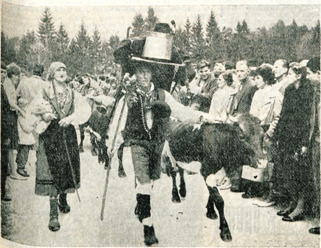
Prihod planšarjev s planin

zdravi in ogoreli, čeprav je bilo zadnje dni zlasti v večernih urah nekoliko hladno. Z njihovim odhodom je otok ostal prazen, zaživel pa bo spet prihodnjo sezono, kakor običajno vsako leto.