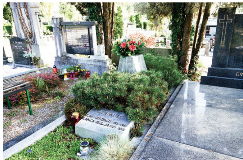
Družinski grob Kovačičevih v Celju z napisom TOVARIŠI EFENKU - POHORCI