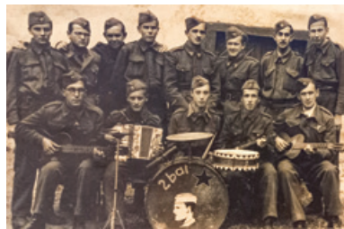
Kulturna skupina Gubčeve brigade

Danes sem pregledovala stare slike in med njimi našla sliko Kulturne skupine Gubčeve brigade s podpis