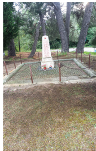
Očiščen spomenik in okolica