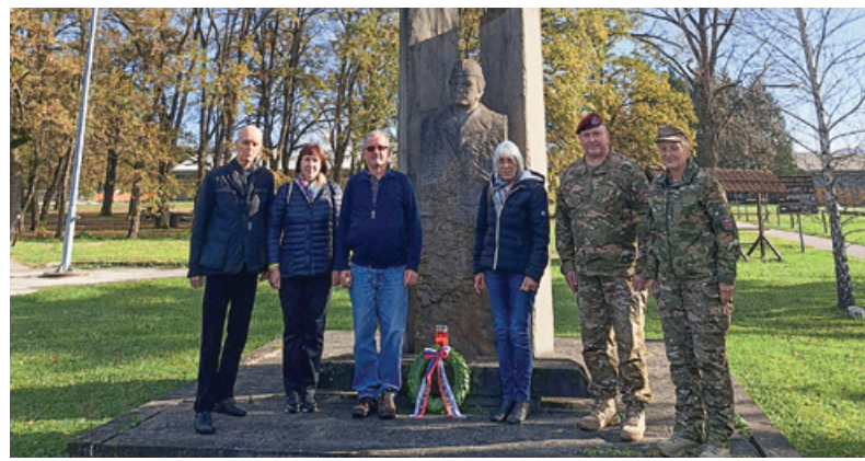
Polaganje venca pri spomeniku Francu Rozmanu - Stanetu v Vojašnici Edvarda Peperka

Potem se je zgodilo leto 2013, ko je novi minister za obrambo Roman Jakič 18. maja vojašnico Celje preimenoval v Vojašnico Franca Rozmana - Staneta. Tudi ta vojašnica v Celju ima pomembno zgodovino. Bila je namreč med drugim domovanje znamenitega 87. celjskega pešpolka, ki je veljal za eno najboljših enot avstro-ogrske armade, njegov pripadnik pa je bil tudi znani borec za severno mejo, častnik Franjo Malgaj. 87. celjski pešpolk je odigral pomembno vlogo v času prve svetovne vojne, ko mu je uspelo ubraniti napredovanja italijanske vojske v znameniti bitki soške fronte na Škabrijelu nad Novo Gorico. To znamenito enoto