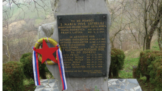
Spomin na enega najhujših zločinov