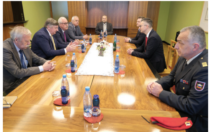
Srečanje na ministrstvu za obrambo Republike Slovenije

vsakršnim oblikam sprevačanja zgodovine, zgodovinskemu revizionizmu in manipulacijam z zgodovinskimi dejstvi za posamezne današnje politične cilje in interese ter aktivno razgaljanje novodobnih pojavnih oblik fašizma osnova delovanja obeh organizacij. Mnogo je konkretnih dejstev, ki jih moramo ohranjati kot skupni zgodovinski spomin, od solidarnosti do pomoči