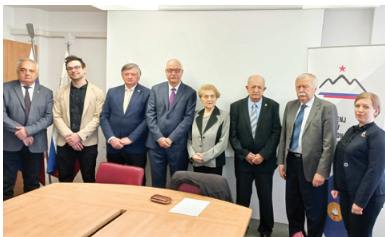
Udeleženci pogovorov na sedežu ZZB NOB Slovenije