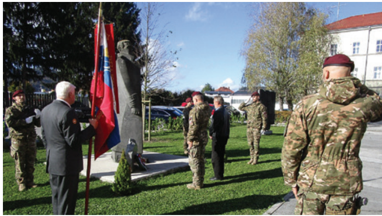
Polaganje venca v Vojašnici Franc Rozman - Stane v Celju

reče z angleškim minometom ni dočkal dneva, ko smo si priborili svojo samostojnost in skupno državo Jugoslavijo. Zveza združenj borcev za vrednote NOB je na obrambnega ministra Aleša Hojsa naslovila pismo, v katerem ga je tako kot pozneje odbor pozvala, naj premisli o preimenovanju Vojašnice Franca Rozmana - Staneta. Ostro so protestirale nekatere politične stranke kot tudi člani KO ZB za vrednote NOB Pirniče. Toda Hojs ni spremenil svoje odločitve.