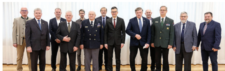
Letos pogoje za sofinanciranje dejavnosti nevladnih organizacij v javnem interesu na področju vojnih veteranov izpolnjuje 13 veteranskih organizacij.