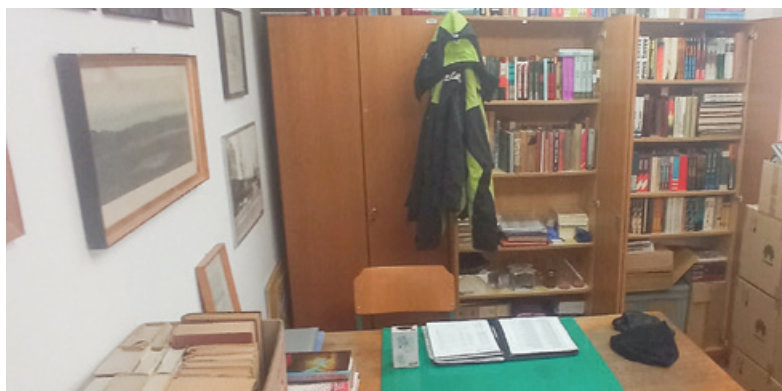
Knjižnica v Savskem naselju deluje v tesnih prostorih.

Seznam literature, ki jo knjižnica hrani, je izredno dolg. »Nekaj je prevedenih del, predvsem pa gre za tematike, ki zajemajo obdobje od leta 1939 do 1980, vse pa so