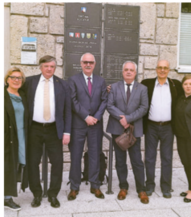
Obisk pri kočevski borčevski organizaciji

Predstavnika SUBNOR Srbije in delegacija ZZB NOB Slovenije so bili tudi na sprejemu pri ministru za obrambo Marjanu Šarcu . Ministra sta predsednika informirala o sodelovanju obeh organizacij. Ob tem je minister Šarec poudaril zgodovinsko vlogo in pomen narodnoosvobodilnega boja slovenskega naroda kot pomembnega temelja naše osamosvojitve in kot dela naše skupne zgodovine, skupnega boja proti fašizmu in nacizmu med drugo svetovno vojno. Spomnil je tudi na nevarnost desnega populizma