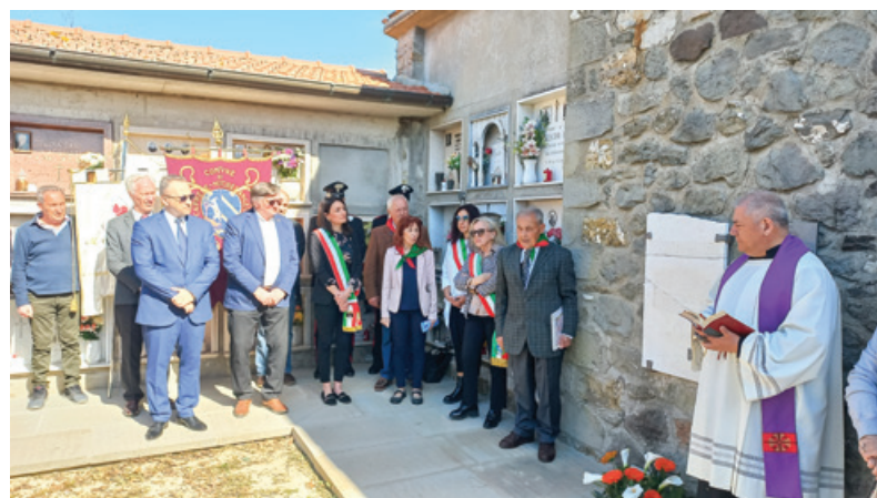
Slovesnost na nekdanjem pokopališču v kraju Caprese Michelangelo