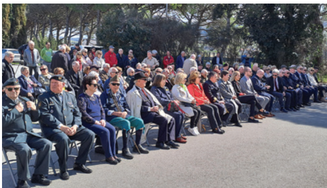
Spominska slovesnost v Strunjanu

V Strunjanu smo počastili spomin na pobite in ranjene otroke, na katere so 19. marca 1921 fašisti streljali z vlaka in ob tem pijani od nacionalizma peli Viva la Prenzana, kot so oni imenovali našo istrsko ozkotirno železnico Istrijanka. Ubili so dva otroke, pet pa ranili, trije so vse življenje ostali invalidi. Nihče od fašistov za to dejanje ni bil kaznovan, nobena družina ni dobila kakršnekoli odškodnine, saj ti otroci so bili za njih le schiavi (sužnji ali podljudje).