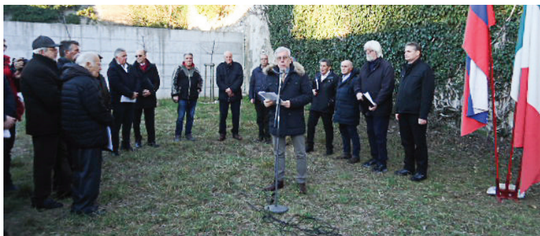
Padli pod streli fašističnih rabljev