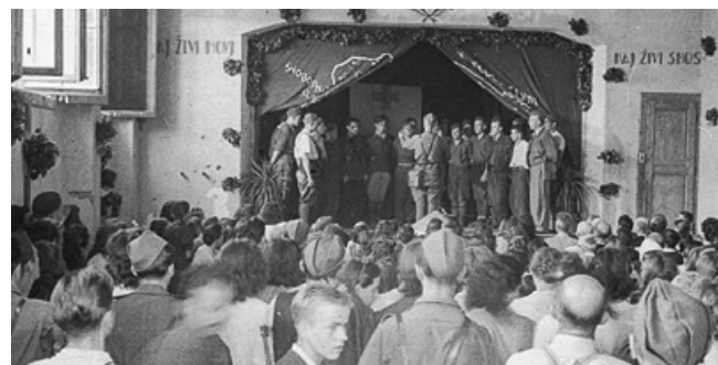
Nastop Invalidskega pevskega zbora 10. avgusta 1944 v Črnomlju

Ustanovitev zbora se je zdela kot novo rojstvo in upanje okrevajočih ranjenecv partizanov. Tisti, ki niso mogli več nositi orožja, so se borili s pesmijo in besedo. Pojoča četa sedemnajstih mladih fantov, izbranih izmed več kot osemdesetih okrevajočih borcev, je v kmečki izbi ene od domačij prizadevno vadila pod taktirko očeta zbora, skladatelja Karola Pahorja. Karol Pahor (1896–1974) je bil akademsko izobražen skladatelj, doma v Vrdeli pri Trstu. Pred odhodom v partizane leta 1943 je kot honorarni pedagog na Glasbeni akademiji v Ljubljani na besedilo Mateja Bora napisal sploh prvo partizansko pesem Hej, brigade.