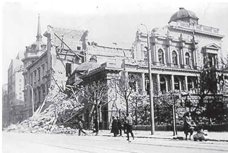
Napad na Beograd 6. aprila 1941

Kako se je zgodila vojna državi in njenemu vodstvu, ki si je predvsem prizadevalo, da je v vojno, ki je potekala že poldrugo leto, ne bi vključili? Da se to ne bi zgodilo, je bilo ob različnih pogledih vodstva, nihanju med Veliko Britanijo in osnimi silami, velikih pritiskih obeh strani ter naklonjenosti dela njenega političnega razreda do nemškega tabora pripravljeno storiti marsikaj – končno tudi vključi-