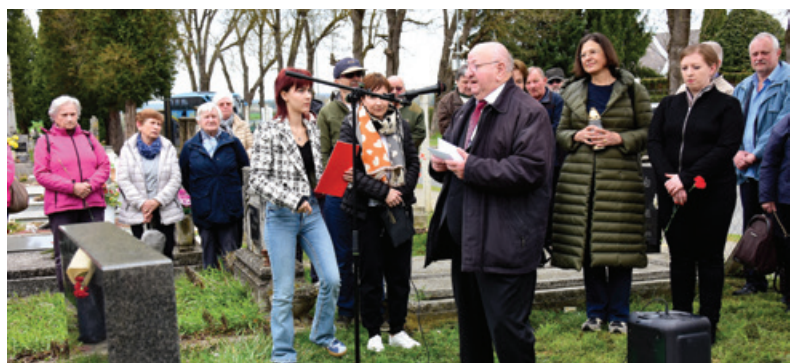
Slovesnost v spomin na padlega partizana

je daleč od rodne zemlje moralo za svobodo ugasiti mlado življenje. Prav tako je poudaril nesmisel in vse trpljenje, ki ga prinašajo vojne. Opomnil je, da se za svobodo moramo boriti, ne smemo je imeti za samoumevno in spodbuditi moramo mlade, naj ne pozabijo zgodovine. Monošter z okolico je bil skozi vso zgodovino pomembno strateško območje in tako je v začetku avgusta 1664 v tem kraju potekala znamenita monoštrska bitka, bitka za obrambo Dunaja pred Turki. Skoraj na istem območju je ob koncu druge svetovne vojne ob prodiranju proti Dunaju padlo v boju z Nemci okrog 400 vojakov in oficirjev sovjetske Rdeče armade. Pred spomenik, ki je na istem pokopališču, smo položili cvetje. Poklonili smo se tudi nedavno umrlemu Jožetu Hirnoku, prvemu predsedniku Zveze Slovencev na Madžarskem, ki nam je pomagal, da so vezi med Slovenci z obeh strani meje ostale trdne in prijateljske. M.K.