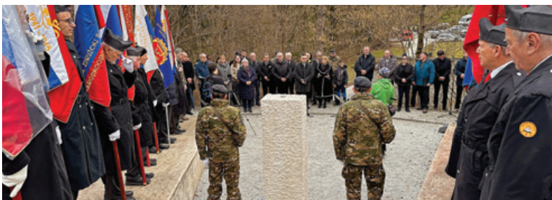
Spominska slovesnost na Oklem