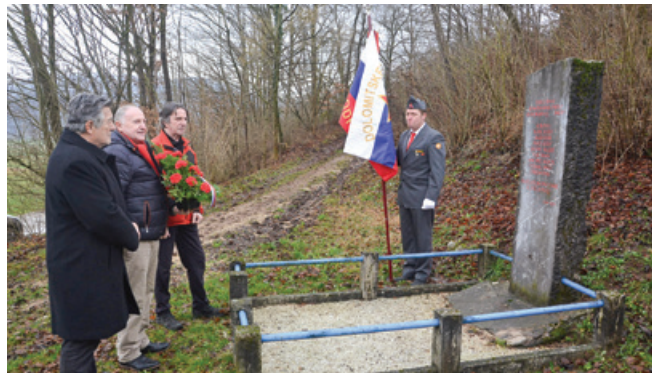
Spominska slovesnost v Kotech

Združenje borcev za vrednote NOB Vrhnika se je 10. februarja poklonilo devetim ustreljenim partizanom v Kotech pri Veliki Ligojni. Delegacija je pri spomeniku talcev, ki so jih pred 81 leti ustrelili nemški okupatorji, položila