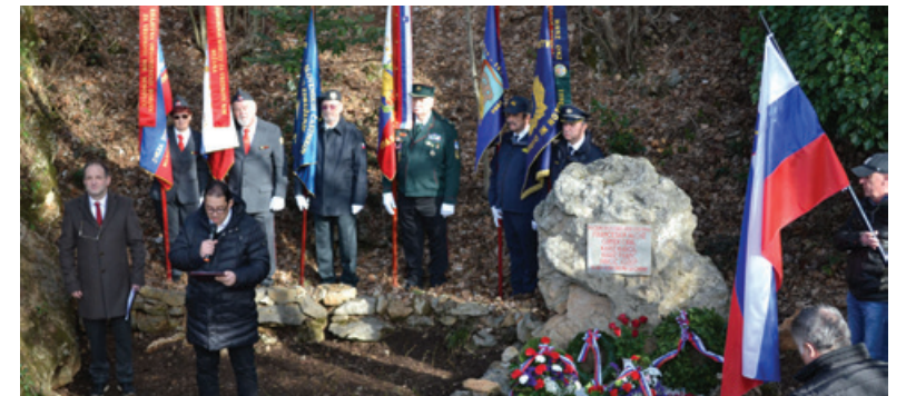
Spominska plošča na skali, kjer so bili talci ustreljeni.