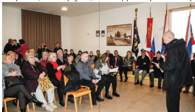
Spominska slovesnost v Kazljah