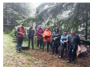
Spomin na padle borce