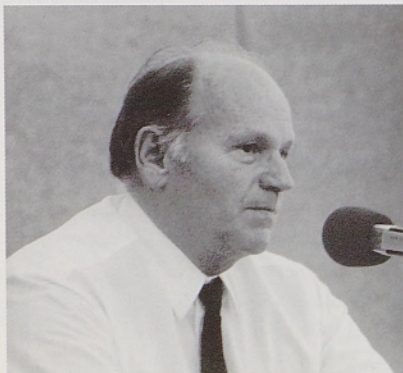
Dr. Jože Pučnik, predavatelj na Dragi 1998