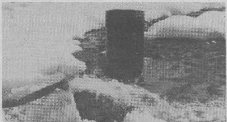
Črni preizkus prve vrtnice. Črpamo 15 l vode na sekundo