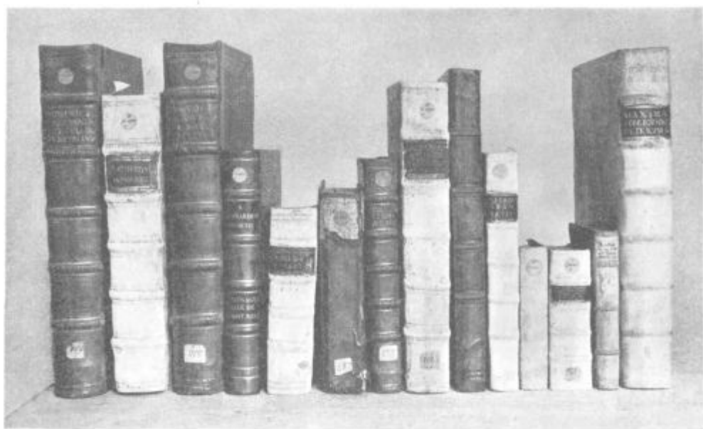
Skupina knjig iz stiške knjižnice, s tipičnimi vezavami in signaturami. Od leve proti desni stojijo številke sledečega seznama: 145, 42, 53, 61, 288, 128, 126, 76, stari stiški katalog, 227, 113, 25, 32, 81.