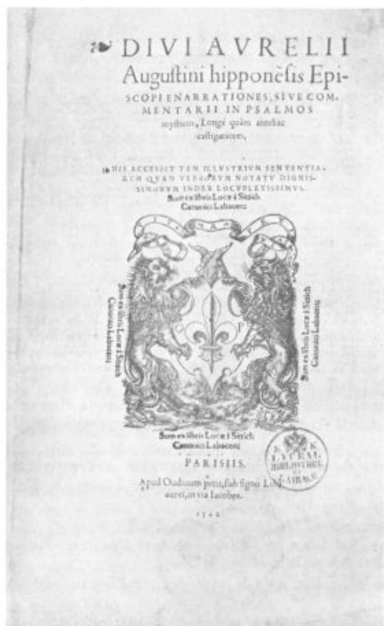
Sl. 4. Exlibris ljubljanskega kanonika Luke iz Stične (št. 41).