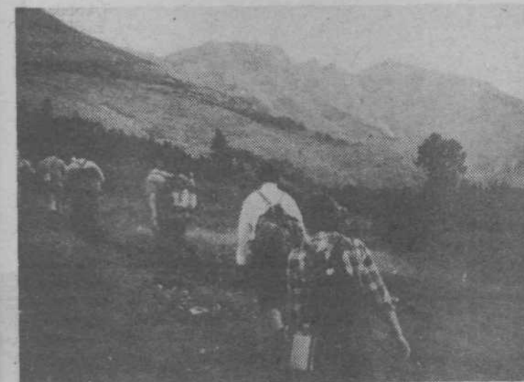
Na poti proti Solunski glavi