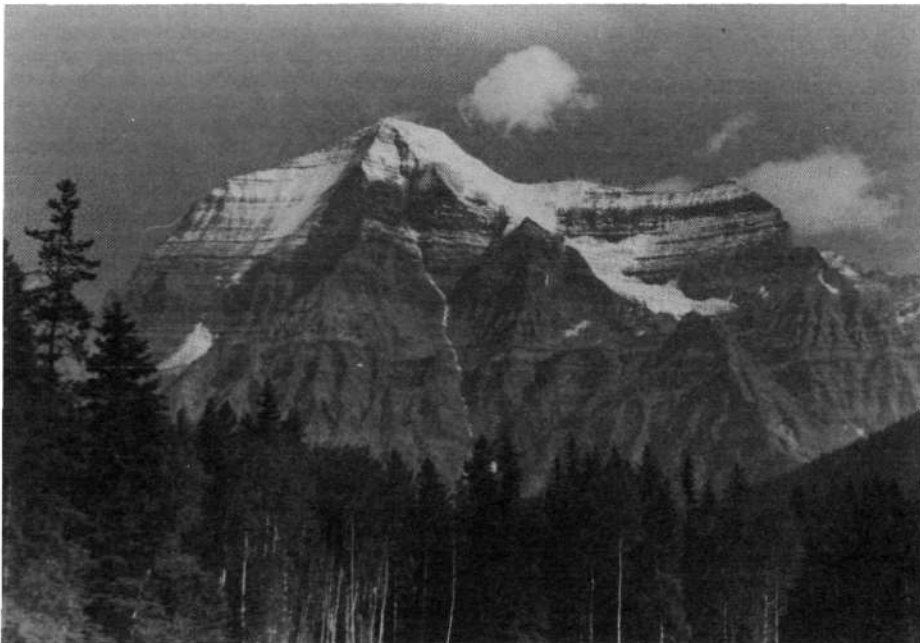
Cisto drugače, lepo in mogočno, se kaže južno ostenje najmogočnejše gore kanadskega Skalnega gorovja Mount Robson (3954 m)