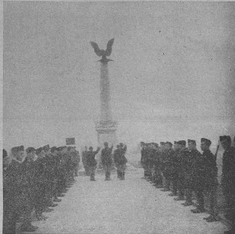
Il Federale ed i Fascisti rendono omaggio ai Caduti per la Rivoluzione al Cimitero di Lubiana.

Eksclenca Robotti s častniki Prezidija se pokloni Padlim za Revolucijo.