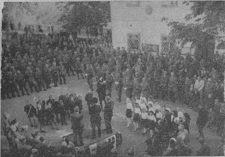
La celebrazione del Ventennale a Črnomelj. Praznovanje dvajsetletnice v Črnomlju.

Anche nei centri minori della Provincia: Kočevje, Velike Lašče, Metlika, Črnomelj, Novo mesto, ecc. fu rievocato l'avvenimento con adunate di popolo veramente consapevoli del volgere di quest'ora così grave di vicende e di avvenimenti.