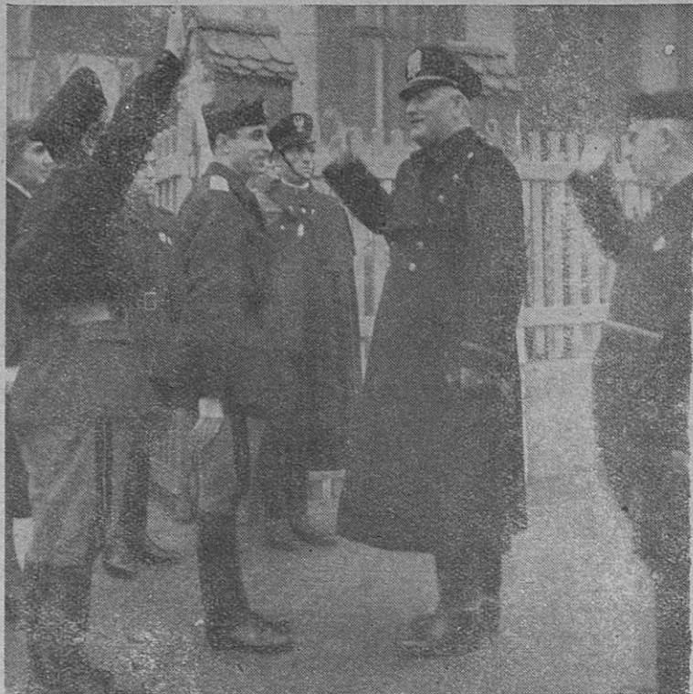
L'Alto Commissario si reca al Sacratio dei Caduti della Rivoluzione nella sede della Federazione Fascista.

Visoki komisar pristopa k svetišču Padlih v Revoluciji na sedežu Fašistične Zveze.