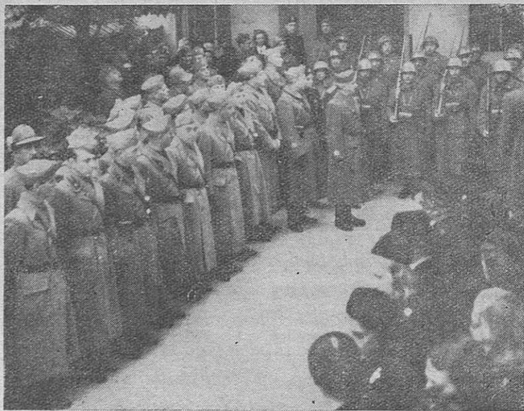
L'Eccellenza Robotti con gli Ufficiali del Presidio rende omaggio ai Caduti per la Rivoluzione.

Lubiana ha celebrato la storica ricorrenza della Marcia su Roma con un rito solenne di omaggio ai Caduti della Rivoluzione, a coloro che per la fede donarono la vita. La rievocazione dell'avvenimento venne fatta nella sede del Dopolavoro delle FF. AA., presenti il Comandante del Corpo d'Armata, il Segretario Federale del P. N. F. ed il V. Com. Federale, il Podestà, i Gerarchi del Partito e le più notevoli personalità italiane e straniere qui residenti.