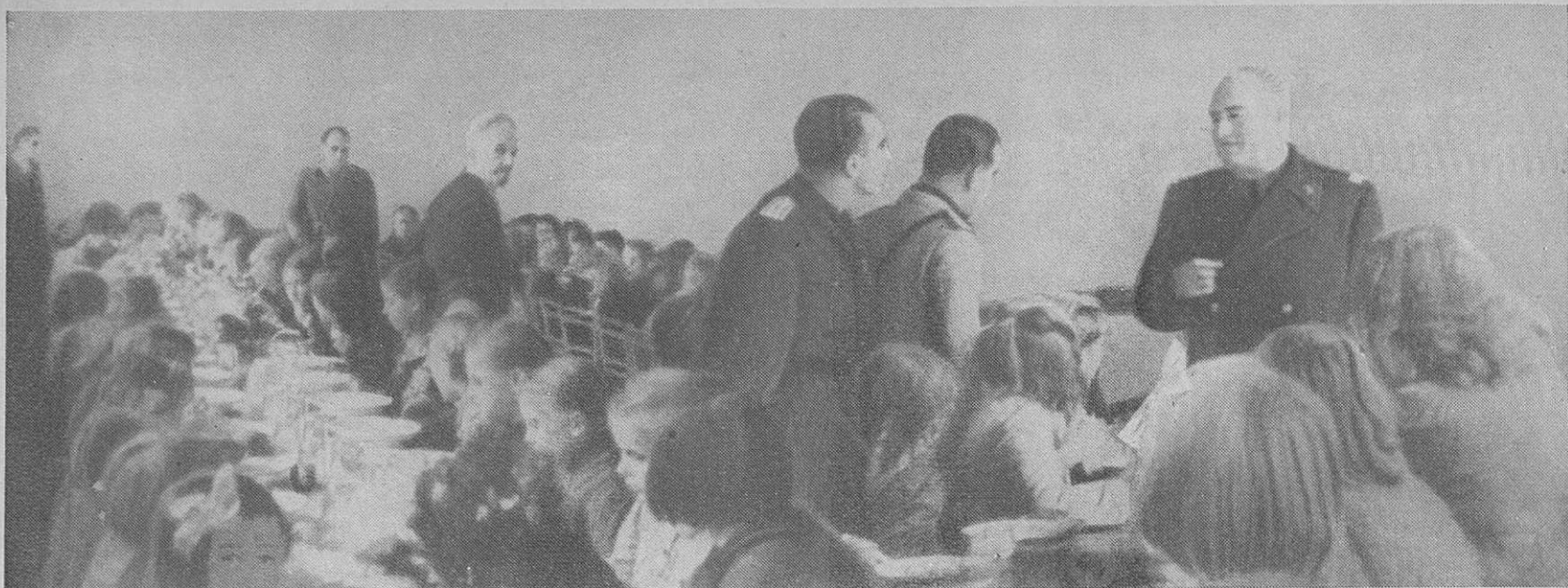
L'Eccellenza Grazioli, Alto Commissario della Provincia di Lubiana, all'inaugurazione della refezione nella scuola Bežigrad - Lubiana Eksclenca Grazioli, Visoki komisar za Ljubljansko pokrajino, ob otvoritvi šolske kuhinje v šoli za Bežigradom, Ljubljana