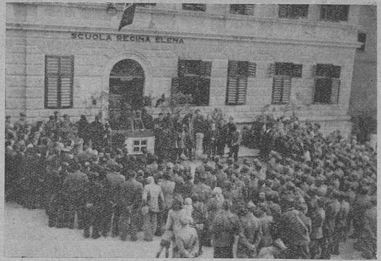
La celebrazione del Ventennale a Metlika. Praznovanje dvajsetletnice v Metliki.

Tudi v manjših pokrajinskih središčih, v Kočevju, Velikih Laščah, Metliki, Črnomlju, Novem mestu itd. se je praznoval dogodek z zborovanji naroda, ki se zaveda pomembnosti te ure, polne izprememb in dogajanj.