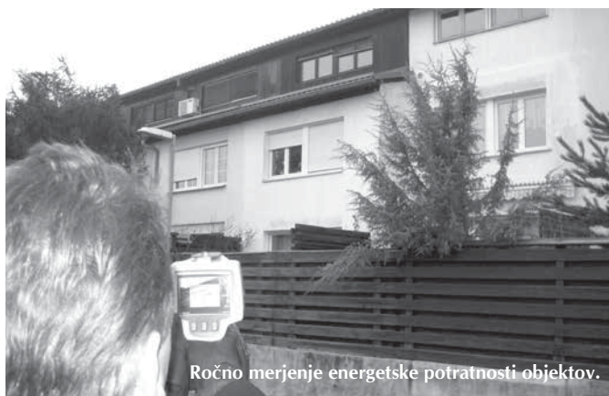
Ročno merjenje energetske potratnosti objektov.

Spodbujanje ukrepov učinkovite rabe energije (URE) in rabe obnovljivih virov energije (OVE) pri občanah je ena izmed nalog Lokalnega energetskega koncepta (LEK) občine Trzin. LEK je bil sprejet leta 2009. Za dvig ravni informiranosti in ozaveščenosti občanov glede URE in OVE so bila v zadnjih treh letih organizirana številna predavanja in delavnice. Izkazalo pa se je, da se da pomagati lastnikom hiš pri odločitvi za energetska prenova še drugače. Posebnost Trzina je, da je večina stanovanjskih hiš v občini stara okrog 30 let in da je med njimi veliko tipskih hiš. Največ hiš istega tipa, kar 155, je v Mlakarjevi, Prešernovi in Reboljevi ulici v naselju Mlake. Po naročilu Občine je bil izdelan pilotni projekt za celovito energetska prenova omenjenih vrstnih hiš. Z dvema predstavitvama konkretnih izračunov (za čelno, sredinsko in hišo z zamikom) konec leta 2012 smo želeli spodbuditi tiste lastnike, ki še omahujejo glede energetske prenove svojih hiš.