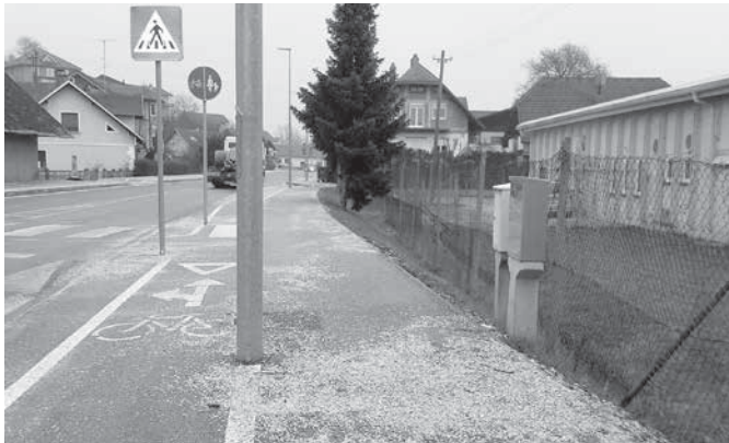
Teden dni po prvoaprilskem ponedeljku so tudi na trzinski »aveniji (Ljubljanski cesti) zapele metle in odnesle zimsko peščeno prevleko, ki nas je ščitila pred dolgotrajnim in trdovratnim mrazom.

Letošnji marec je bil vse kaj drugega kot sušec! No ja, morda na Islandiji, kjer so imeli najbolj sončnega v tem tisočletju. V Reykjaviku je bilo marca kar 163 ur sonca, v naši prestolnici pa samo 103. Še dobro, da se je v drugi polovici aprila končno le ogrelo. Sicer se bo letos sneg malo višje še dolgo talil, ljubitelje gora pa že zdaj opozarjamo na to, da bo letos poleti tam veliko obsežnih snežišč, ki bodo vztrajala večji del poletja. Kljub otoplitvi se zdi, da so pri nas nekateri še vedno z(a)mrznjeni. Ali jih je res tako zdelala dolga in snežna zima ali pa se tako rekoč v ilegalni pripravljajo na svoj veliki »come back«, če so novinci, pa bolj na »deux et machina«. V obeh primerih gre za »nadbijta«, pri slednjem za boga na škripčevju, ki so ga nekoč sredi predstave spustili na oder, da bi hipoma rešil problem oziroma težavo. V Trzinu bi seveda potrebovali koga, ki bi bil tak, a kaj ko se lahko zgodi, da bi se škripčevje, ki bi ga čez nekaj časa moralo potegniti nazaj med bogove, lahko pokvarilo. Kako huda je bila letošnja zima oziroma snežna sezona, prav tako priča dejstvo, da je tudi Trzincem odnesla gregorjevo, ni pa nam vzela luči.