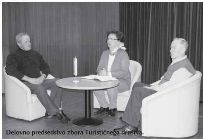
Delovno predsedstvo zbora Turističnega društva.

Mesec marec, znanilec pomladi, ki letos to žal ni, pa vseeno zavezuje predsednike društev, da skličejo in izvedejo zbor članov. In tako smo se člani TD Kanja Trzin, kot zadnji, zbrali v četrtek, 28. marca, v CIH na srečanju.