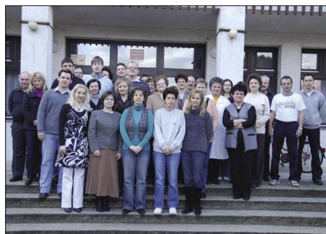
Kolektiv Srejdnje poklicne šaule Béla III.

školnikov s svojim ravnatelom je pa v tau časi vöpokazo, ka leko včinijo döjšno pa fizično padaši, kolegi sami tü pri tejm, aj se človek ma mauč vöskopati