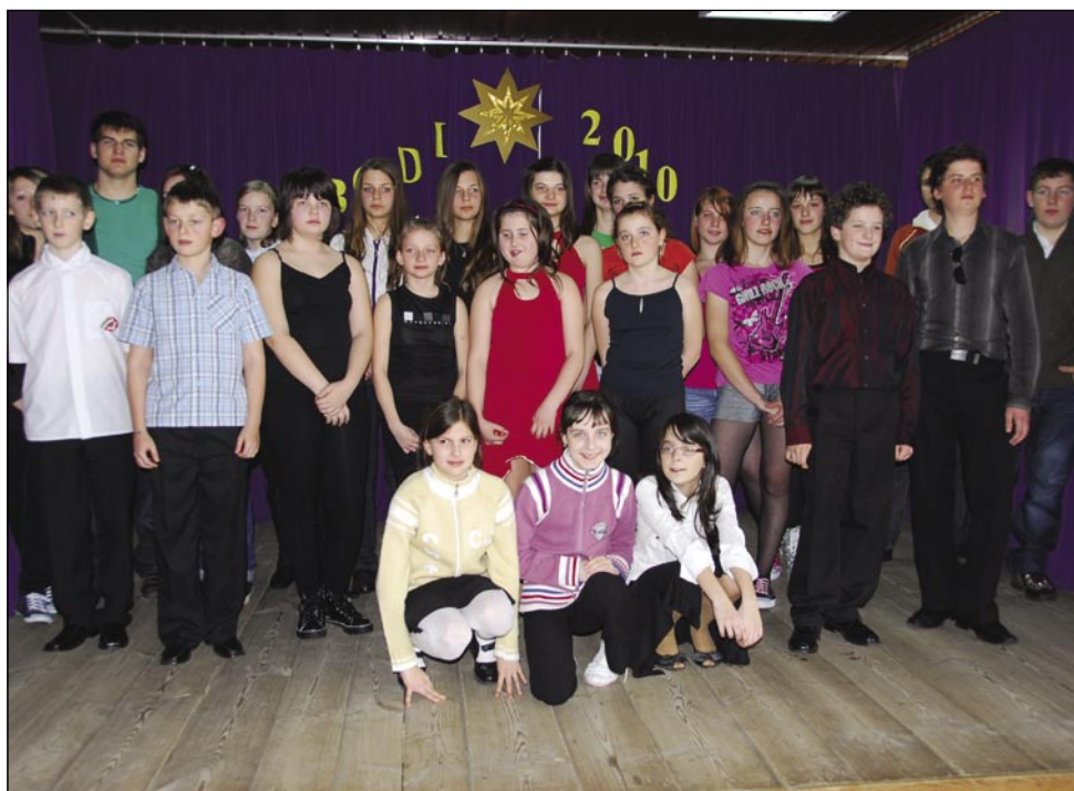
Vsi nastopajoči na Porabskem slovenskem kvizu - Bodi zvezda 2010