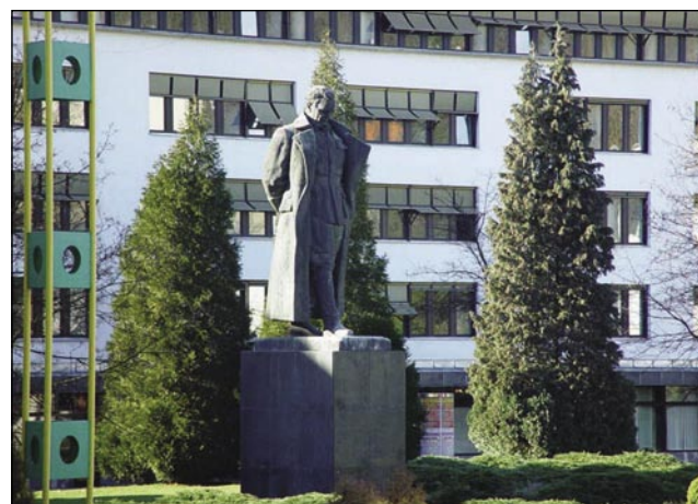
Maršal Tito eške itak skrb má na narode v Velenji

Kauli Velenja je dosta gradov, zatok krajino zovémo »dolina