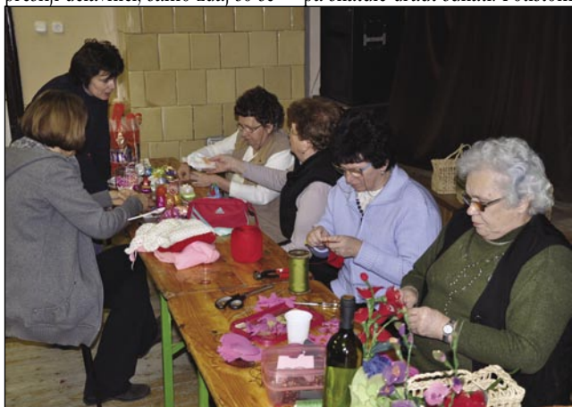
Ženske z Goričkoga so pokazale »nauve« maštrije tó

tao se te delavnice za nekaj cajta zaprejo. Gda pride gesen pa se vanej delo skonča, te se »mojstri pa inaške« pa znauva srečamo. Ideje eške majo dosta, mi mladi se pa dosta leko včimo od zreli žensek. Kakšne novejše stvari, okraske delati tó, dapa prvotni cil tej de-