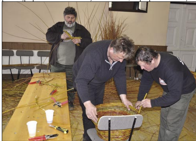
Etak se dela prejlönč na košaro

tó nika nauvoga pa zanimivoga bilau za nas. Zdaj se je tó pokazalo, ka ka vse se leko napravi, če stoj malo ideje pa talenta ma. Dostakrat po bautaj kaj vidimo, pa te mislimo, kak se tau leko napravi, pa mi tó dosta vse vejmo, samo bi si mogli cajt vzeti za kaj taše.