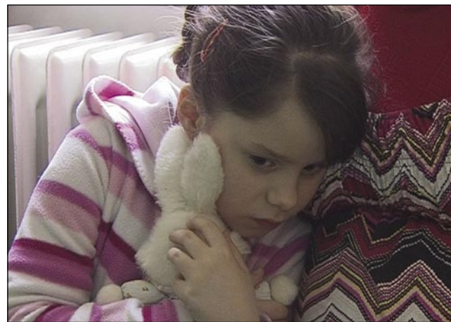
»Joj, to bo šola?«

majhna, lahko ponuja pouk, ki je prilagojen individualnim