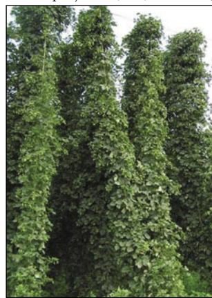
Za pivo so samo ženske šküfke hmelja dobre

Nej daleč od Celja leži varaš Štorre . Tam so že pred dvejstau lejtami najšli barnasti kuln (vaugelge) v zemlej. Nej dugo za tejm so že s pomočjav toga kulna redili železo pa jeklo (acél) v varaši,