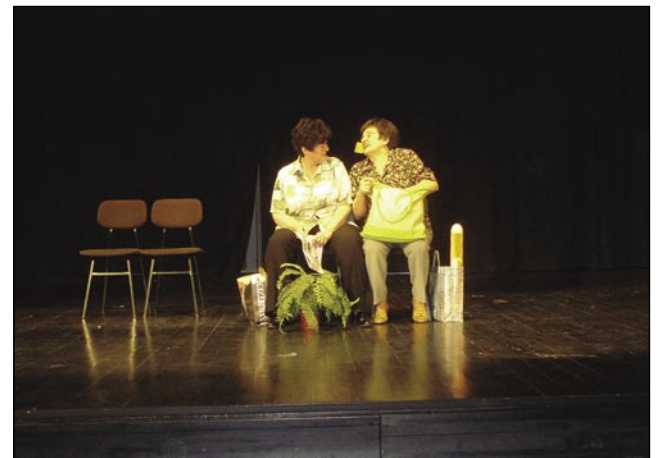
Duo Fodor na odru

V soboto, 6. marca 2010 pa sta na trnoveljski oder stopili dve gledališki skupini Zveze Slovencev na Madžarskem, z dvema enodejankama v sočnem prekmurskem, porabskem narečju, kar je bila še