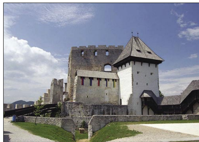
Močni gospaude Celja so nücali kuste stene

etoj zidini so Boga molili kartuzijani, takši baratke, šteri so fejst sigurno živeli, eške gučati so nej smeli. Kauli leta 1400 je biu v toj zidini center vsej kartuzijanov v cejlöj Evropi, od tistec so vodili zidanje nauvi klauštrov. V tistom cajti so v knjižnici skrb meli na 2000 knig, štere so vse z rokami napisane bile. Leta 1792 je casar Jožef II. dau zaprejtj žičko kartuzijo, od tistoga ipa je klaušter skoro na niköj prišo. Gnes ga gorziške kauli dvajsti gezero lödi na leto, vendar zatok tö, ka pri njegovij dveraj vino toči petstau lejt stara, najstarejša krčma v Sloveniji.