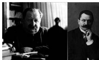
18. POHOD PO POTI IVANA POTRČA IN MATIJE MURKA