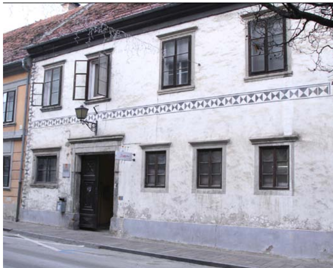
Hiša na Prešernovi ulici 22 danes

Na hišo je bila tja do konca 18. stoletja vezana realna krojaška pravica, kar pomeni, da so njeni lastniki na Ptuj in v neposredni okolici izvajali krojaško obrt. V zadnjem desetletju omenjenega stoletja je za krajši čas pristala v rokah gradbenega mojstra, nato meščanskega špitala, od leta 1807 in vse do začetka druge svetovne vojne pa so si jo lastili trgovci.