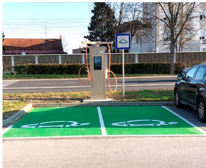
Elektropolnilna postaja na parkirišču Lackova pri podhodu Borovo

Mestna občina Ptuj je v novembru izvedla postavitev dveh novih elektropolnilnih postaj za električne avtomobile. Elektropolnilni postaji sta na lokaciji parkirišča Lackova pri podhodu Borovo in parkirišču pri Zdravstvenem domu Ptuj. Polnilni postaji delujeta kot hitre polnilne postaje (DC-polnilnice), ki so zelo priljubljene pri uporabnikih električnih vozil, saj avtomobil napolnijo v 40–90 minutah. Zraven električnih avtomobilov se lahko polnijo še druga elektrovozila, kot so kolesa, skuterji, vozila kategorije L7e in invalidski vozički. V ta namen so polnilnice opremljene z vtičnico Schuko. Uporaba električne polnilnice je brezplačna za vse uporabnike. Mestna občina Ptuj s tem širi mrežo elektropolnilnic s ciljem zagotavljanja električne mobilnosti, kot kaže tudi smer razvoja transporta v bližnji prihodnosti. A. G.