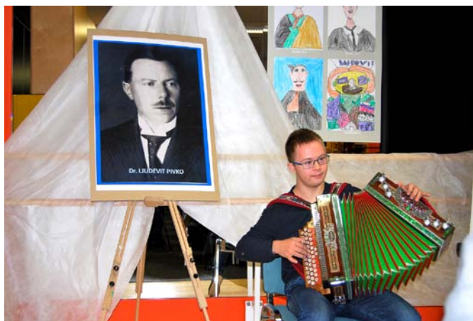
Na proslavi je zaigrala tudi harmonika.