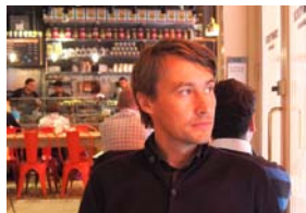
ALEŠ ŠTEGER: NEVEREND