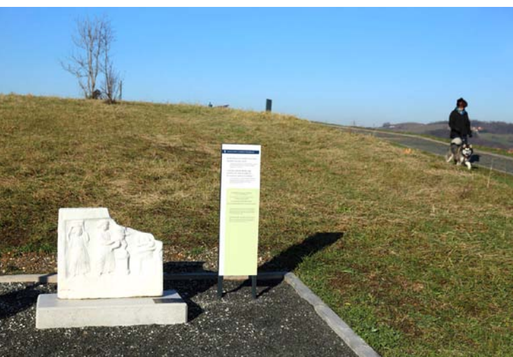
Panorama postaja arheološki park. MO Ptuj je letos uredila sprehajalne poti, namestila urbano opremo ter razlagalne table in odlitke antičnih spomenikov.