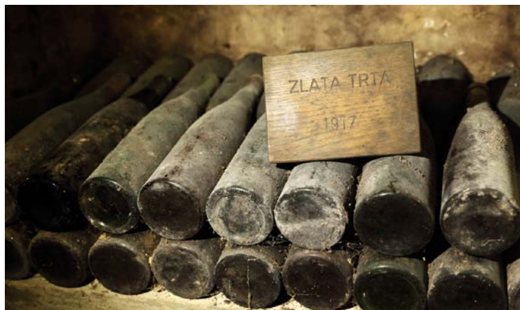
Ptujška klet hrani izjemne vinske zaklade, med katerimi izstopa zlata trta – najstarejše ohranjeno vino v Sloveniji, ki letos praznuje častljivo 100-letnico.