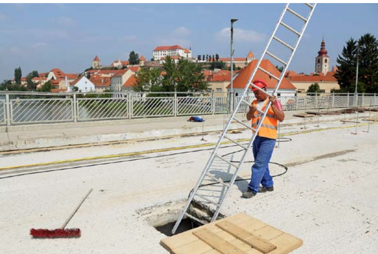
Stari most čez Dravo bo končno deležen celovite obnove, kar bo zagotavljalo vamejšo uporabo tako za voznike kot pešce. Popolnoma prenovljena bo tudi notranjost zahtevne konstrukcije, vključno z vso drugo infrastrukturo.