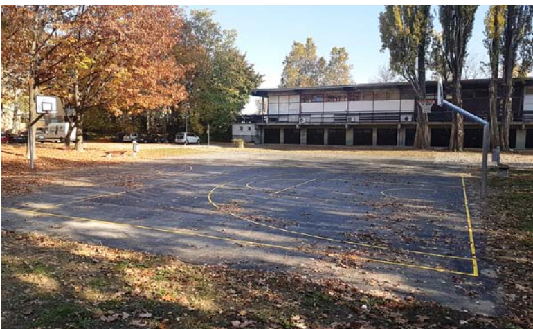
V 2017 je MO Ptuj nadaljevala ureditev otroških igrišč in poleg prenove dotrajanih priskrbela tudi nekaj novih. Prenove je bilo deležno tudi igrišče za avtobusno postajo.