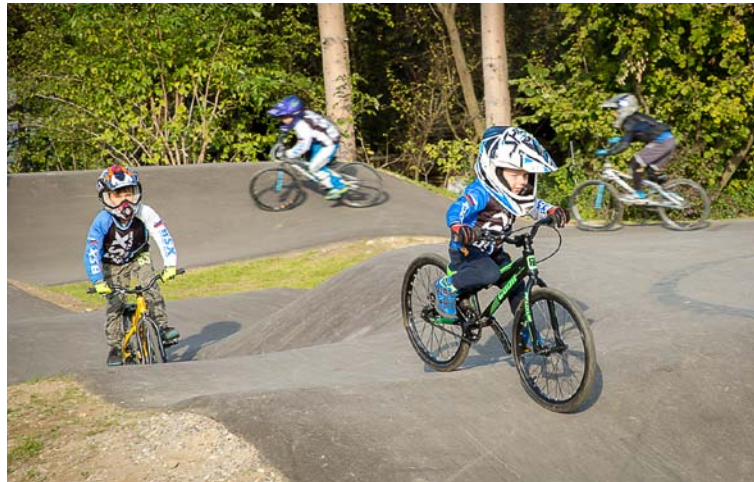
Ptuj je od letos bogatejši tudi za t. i. tlačilno stezo ali pumptrack (ob parkirišču P+R Zadružni trg), ki so ga mestu podarili pobudniki in donatorji izgradnje omenjenega poligona.