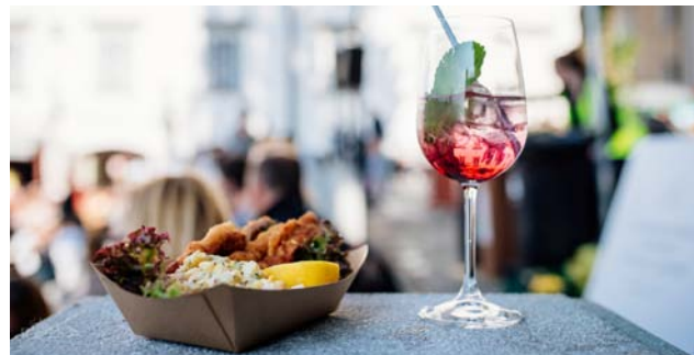
Zavod za turizem je konec julija za kulinarčne sladokusce prvič pripeljal na Ptuj Odprto kuhno, kjer smo lahko razvajali brbončice z okusi sveta.