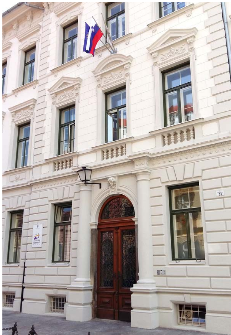
Pred začetkom novega šolskega leta se je končala obnova pročelja OŠ Olge Meglič na Prešernovi in Cafovi ulici. Sredi novembra je bila podpisana pogodba o projektiranju OŠ Mladika. Glavni namen investicije v prizidavo in rekonstrukcijo OŠ Mladika je potreba šole po novi, ustrezni jedilnici.