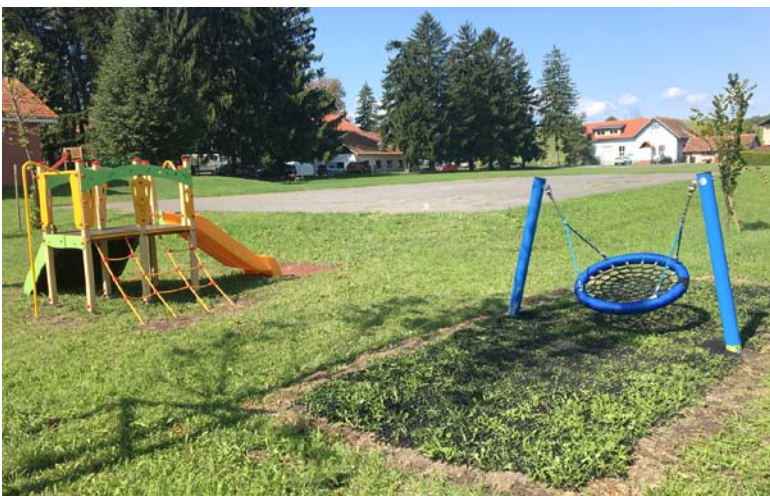
Nova igrala so prejele tudi enote Vrtca Ptuj: Mačice, Narcisa in Marjetica, kjer so bila igrala najbolj dotrajana. Vsem otrokom želimo veselo in varno igro.