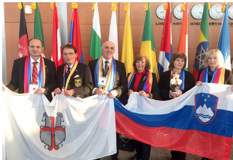
Ponosna delegacija MO Ptuj in Ministrstva za kulturo po sprejetju obhoda kurentov za vpis na Unescov seznam na zasedanju v Južni Koreji.