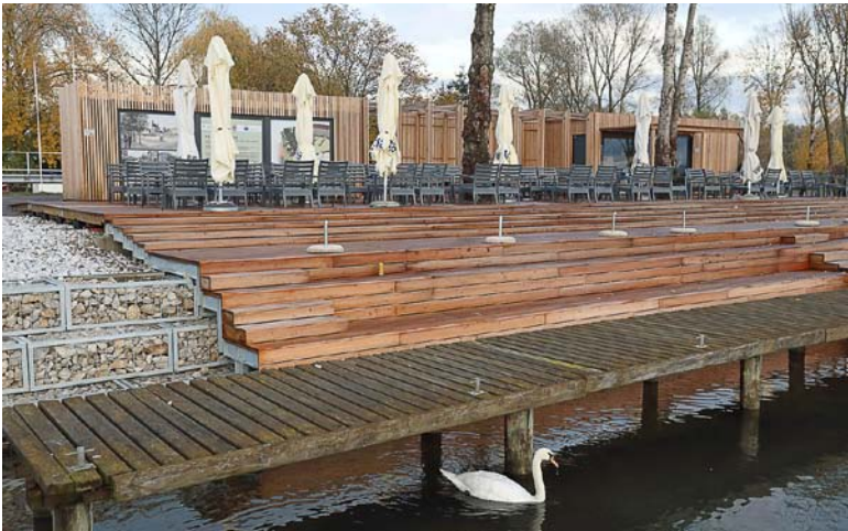
Na Ranci je nastalo novo priljubljeno zbirališče, ki s sončno in lepo urejeno teraso v toplejšem delu leta privabi veliko ljudi.