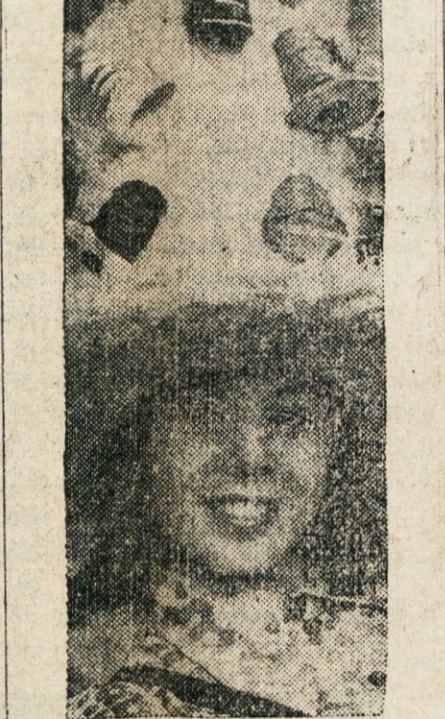
MOGOČEN KLOBUK — Na razstavi peresnih klobukov v Londonu na Angleškem je dobil tale na sliki prvo nagrado. Mogočen klobuk iz peres je okrašen z vrsto malih peresnih klobučkov.

To je bil torej mož, ki sta ga poklicali mati in sestra za dan nesreče, ki se jim je bližal, sebi v tolažbo in očetu v oporo.