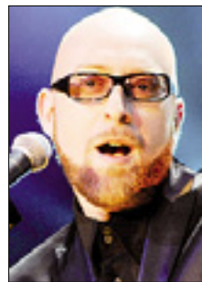
MARIO BIONDI