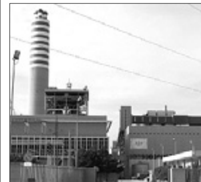
Termoelektrarna podjetja A2A

Na okoljskem ministrstvu v Rimu so včeraj odobrili prošnjo podjetja A2A, ki je zaprosilo za dovoljenje za porušnje in odstranitev odrabljenih rezervoarjev za kurilno olje v tržiški termoelektrarni. Zasedanja storitvene konference, na katerem so prižgali zeleno luč za rušenje, so se udeležili tudi predstavniki dežele Furlanije-Juljske krajine in tržiške občine, ki so podprli sklep ministrstva, saj gre za ukrep, ki je iz okoljskega vidika dobrodošel.