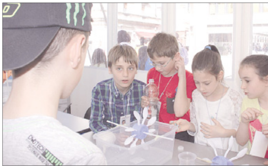
Učenci šol Župančič (prva levo in zgoraj) ter Trinko (levo) med prikazom svojega dela

pančič. Najprej so preiskali riž, moko in jabolko v iskanju škroba, pri čemer so uporabili nekaj kapljic jodove tinkture. V nadaljevanju so obdelali tekočino v iskanju kislega ali bazičnega učinka ter opravili so različne meritve temperature, vlage in zračnega tlaka s pomočjo termometra, higrometra in barometra. Sami so tudi izdelali majhen barometer s pomočjo pločevinke, balončka in cevke. »Sami smo ga naredili,« so ponosno povedali in dodali, da so izdelali tudi pano, na katerem so obrazložili, da voda pri 0 stopinjah Celzija zmrzne, pri sto stopinjah pa izhlapi. Tudi za šolo Župančič ni šlo za prvo udeležbo na festivalu Scienza Under 18, napovedali pa so že, da bodo spet prišli tudi prihodnje leto.