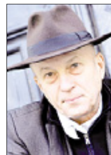
VLAĐO KRESLIN ARHIV

Prljavo kazalište - Po več kot 35 letih delovanja na glasbeni sceni ter nešteti koncertih in ploščah jih bo Ljubljana lahko ponovno slišala v njihovi najboljši »best of« izdaji. »Prljavci« bodo nastopili v Cvetličarni v soboto, 14. maja, in predstavili vse največje uspešnice skupine, med katerimi si gotovo lahko v spomin priključite Crno bijeli svijet , Sve je lako kad si mlad , Heroj ulice , Ne zovi mama doktora , Mi pijemo , Zaustavite zemljo , Marina , Pisma ljubavna in mnoge druge. Prljavo kazalište obljublja koncert poln emocij v slogu s svojimi številnimi uspešnicami. Vsekakor se obeta koncert legend, vreden obiska. Skupina se je kar hitro po nastanku pred skoraj štiridesetimi leti poimenovala Prljavo kazalište po eni od epizod iz kulturnega stripa Alan Ford . Njihov prvi večji nastop je bil na Poletovem koncertu leta 1978 in kmalu je skupina dobila svojo publiko. Cene vstopnic v predprodaji: prvih 100 15,00 €, nato 19,90 €.