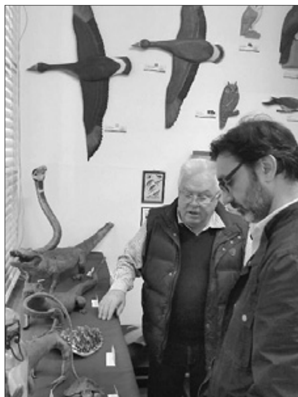
Zbirka školjk (levo); Spagher med vodenim ogledom zbirke nagačenih plazilcev (desno)

Naravoslovni in geološki muzej v Ulici Brigata Avellino je odprt ob torkih in petkih med 10. in 18. uro; ogled je možen tudi druge dni v tednu, vendar se je treba v tem primeru pravočasno najaviti na telefonski številki 342-8699900. (dr)