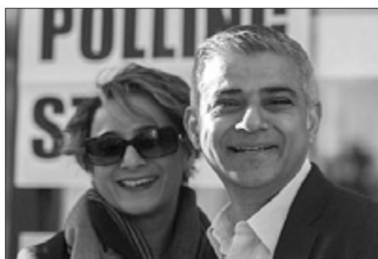
Nov verjetni župan Londona Sadiq Khan z ženo

Ti. super četrtlet, kot so dan volitev poimenovali britanski mediji, velja za prvi preizkus za vodjo laburistov Jeremyja Corbyna, ki je vodenje stranke prevzel konec lan-