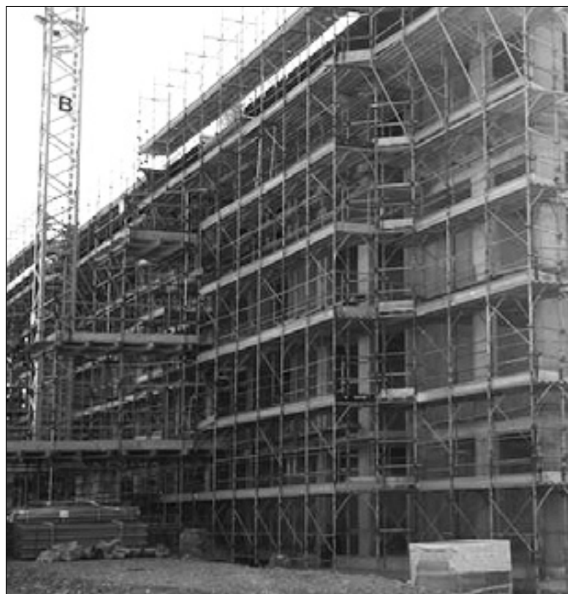
Novogradnja v Ulici San Michele

»Za davek Tasi na prvo stanovanje velja stopnja 1,5 promila, za davek na drugo stanovanje je stopnja, najnižja možna, 7,6 promilov. Davke smo znižali iz zelo preprostega razloga: biti moramo privlačni. Že v Mošu plačujejo davek Irpef, da ne govorimo o Trstu, kjer je stopnja tega davka 0,8 promila. To pomeni, da na dohodku 1000 evrov plačaš osem evrov na mesec. V celem letu se nabere že precejšnja vsota denarja,« poudarja Romoli, ki je posebno zadovoljen, da so od leta 2009 do današnjih dni znižali zadolženost goriške občine. »Pred sedmimi leti je občinski dolg znašal 29 milijonov evrov, ob koncu lanskega leta pa le 2,9 milijona,« poudarja župan, ki je kritičen do državne vlade Mattea Renza. »Renzi daje državljanom osemdeset evrov, vendar s tem še dodatno povečuje zadolženost države. Mi smo se odločili za čisto drugačne ukrepe v duhu liberizma. Znižali smo davke, tako da vsak mesec v žepih naših občanov ostane tistih dvajset, trideset evrov več, ki jih lahko družine porabijo za nakupe ali za kritje drugih stroškov. Gre za dve različni viziji, naša se obrestuje,« ugotavlja župan Ettore Romoli. (dr)