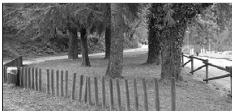
Grajski park v Ulici Giustiniani