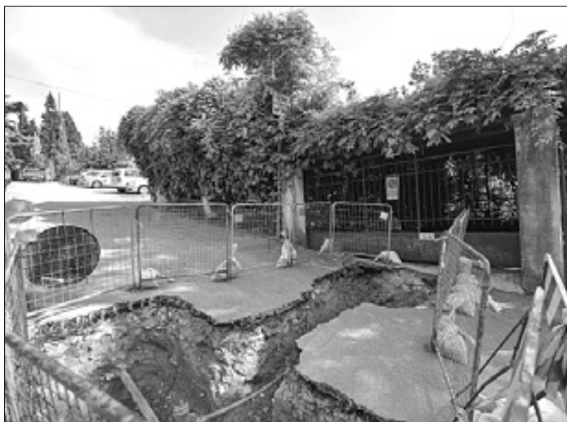
Gradbišče na občinski seji v Brojenci že nekaj časa »miruje«