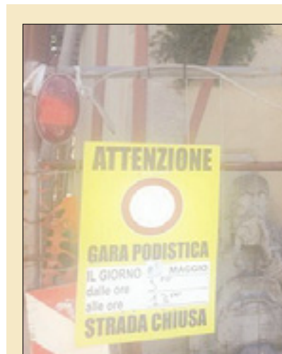
Enojezični napis v Križu

Zaradi tekaškega dogodka bo jutri marsikje vladal poseben prometni režim, zaradi česar se od občanov in občan pričakuje velika mera potrpežljivosti. Od 5. ure zjutraj do 16.30 bodo za ves promet zaprti pokrajinske ceste na Krasu, številne ulice in celoten Miramarski drevored. Omejitve parkiranja in ustavljanja bodo veljale tudi v mestnem središču, kjer bodo ulice namenili tekačem, reševalnim vozilom, silam javnega reda, sponzorjem in drugim akterjem, ki sodelujejo pri izvedbi letošnje Bavisela. Občina Trst tudi sporoča, da bo prepoved parkiranja in ustavljanja dosledno treba upoštevati tudi na občinskem območju med silosom in vhodom v Staro pristanišče.