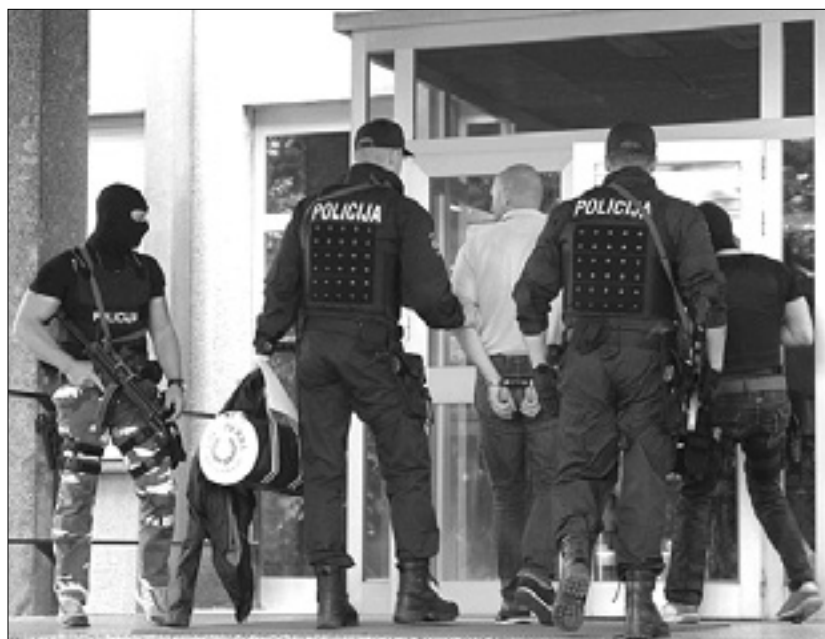
Četrtkova privedba osumljenih je vznemirila marsikaterega Novogoričana

Ker se podoben trend v tržiški občini nadaljuje tudi letos, so se odločili, da bodo preuredili nekdanje prostore zdravstvenega podjetja v Ulici Vecellio. V posloppju so pred leti že sprejemali priseljenke, vendar so zatem leta 2008 v stavbi uredili informativno točko za tujce in v njej prirejali tudi jezikovne tečaje. Posloppja v zadnjih letih sameva; na tržiški občini so pred časom razmišljali, da bi v stavbi uredili dnevni center za goste doma za starejše občane; zamisli še niso uresničili zaradi omejevalnih določil pakta stabilnosti, ki niso dopuščale, da bi posloppje prenovili.