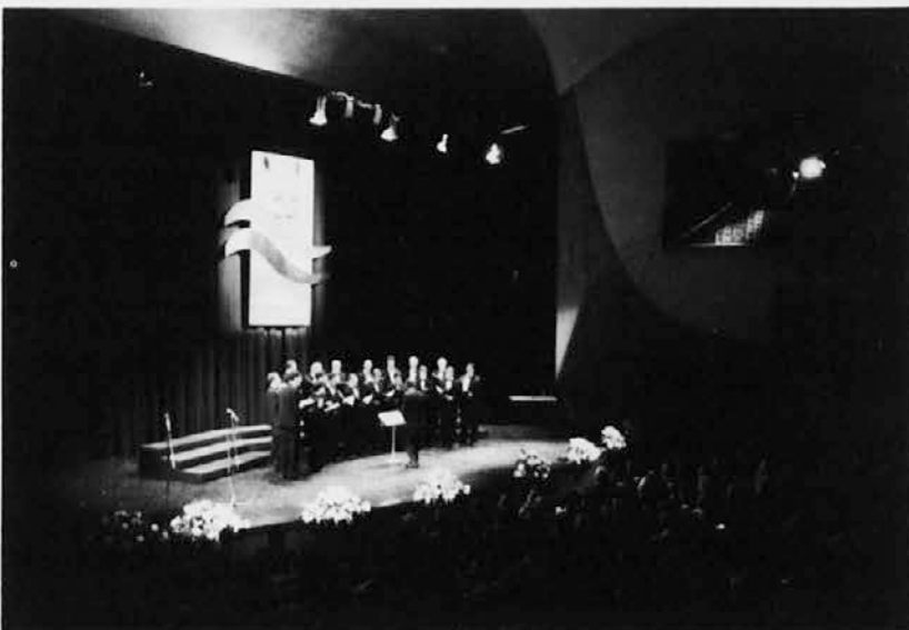
Posnetek z zaključnega koncerta jubilejne Primorske poje v tržaškem Kulturnem domu

Primorska poje je gotovo ena tistih kulturnih pobud, ki so pojem ljubiteljskega delovanja, je pa prav gotovo tudi dokaz, kako ljubiteljski zbori opravljajo izredno pomembno kulturno in tudi družbeno ter narodno poslanstvo, duhovnega bogatenja pevcev samih in tudi krajev, kjer delujejo.