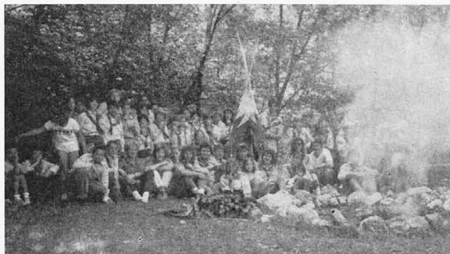
Nepozabni spomin na povsem uspešen tabor goriških volčičev in veveric »Kal-Koritnica 89« pod neopaznim varstvom miroljubnih »Indijancev«