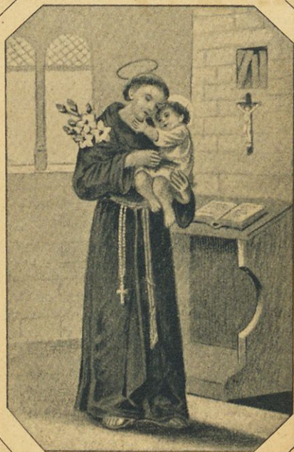
Sv. Anton Padovanski, prosi za nas Boga!