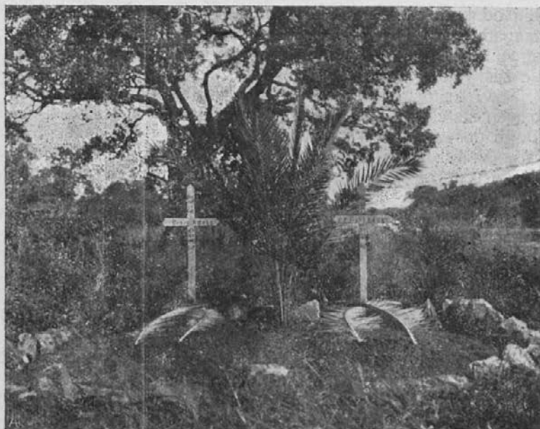
Gomila O. Lauer-a O. M. I. pri Andarao (Okawango N. J. Z. — Afrika.)