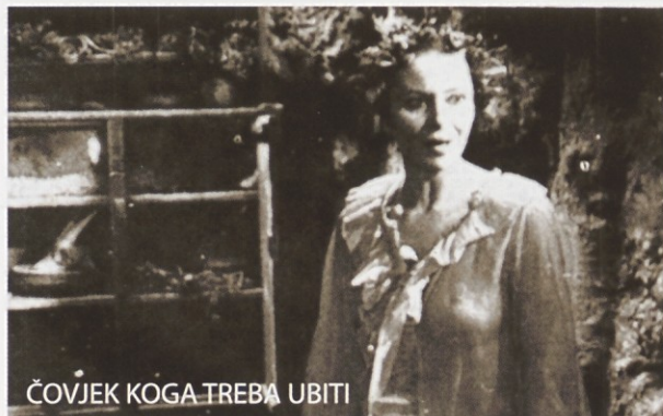
ČOVJEK KOGA TREBA UBITI