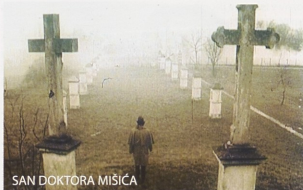
SAN DOKTORA MIŠIĆA