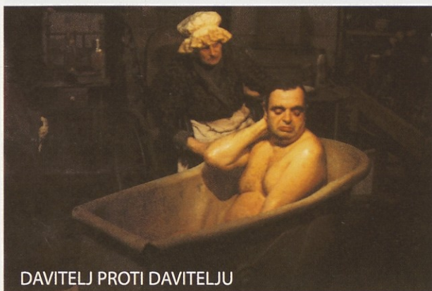
DAVITELJ PROTI DAVITELJU