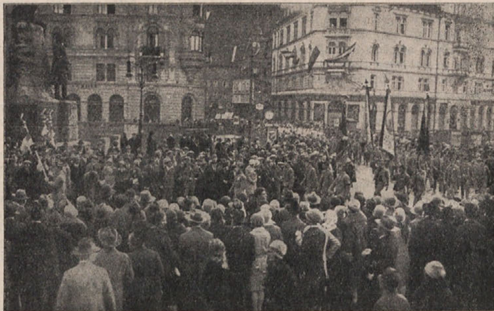
Orli pri proslavi desetletnice narodnega osvobojenja v Ljubljani, dne 28. okt. 1928.

Uspeh — od neke meje — ne raste več v istem razmerju kot vloženi trud in kapital. Zakon o pojemajočem donosu.