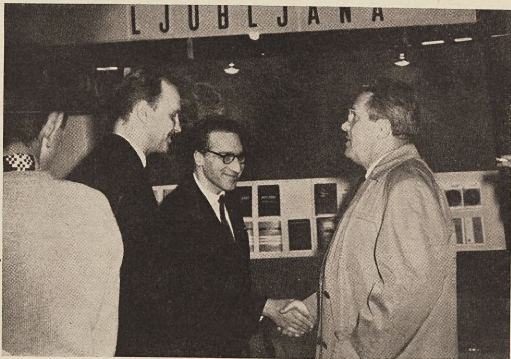
Ureditev razstavnega paviljona Cankarjeve založbe na VII. mednarodnem knjižnem sejmu v Beogradu od 6. do 12. novembra je vzbudila precej pozornosti. Med drugimi si je našo razstavo podrobno ogledal tudi podpredsednik Zveznega izvršnega sveta tovariš Edvard Kardelj (na sliki)