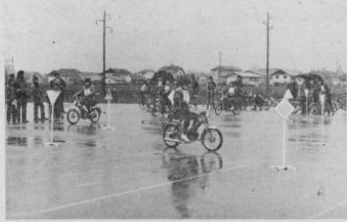
Srednješolci med tekmovanjem na igrišču OŠ Ivana Spolenaka