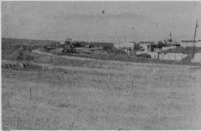
Gradnja spremljajočega objekta in ceste