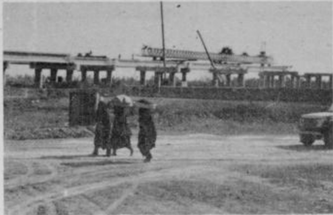
Del mostu čez reko Evfrat (posnetek je starejši, sedaj je zgrajeno že precej več)