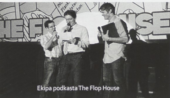
Ekipo podkasta The Flop House