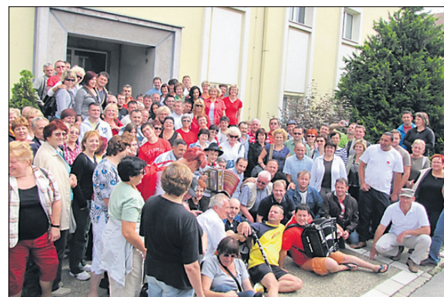
Ormožani in Središčani so bili na sejmu sliv v Srbiji.