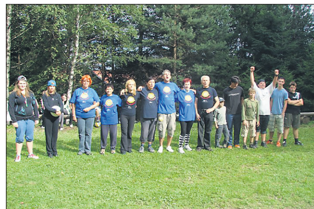
Nestrpnost pred nogometno tekmo

Zelo živahno je bilo tudi v »frizersko-pedikerskem studiu«, katerega usluge so brezplačno opravljale naše iznajdljive vnukinje, ki so v stilsko preobrazbo prepriča-