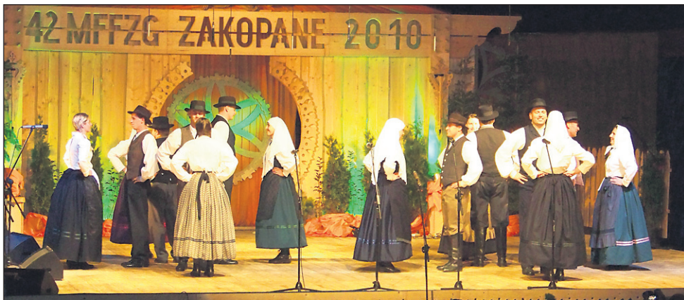
Člani FD Lancova vas s svojimi nastopi v tujini skrbijo za promocijo svojega kraja, občine in ne nazadnje Slovenije.