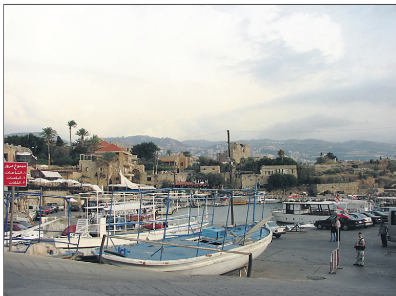
Byblos naj bi bilo najstarejše neprenehoma naseljeno mesto na svetu.