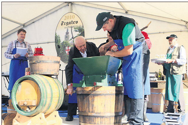
Že po tradiciji so simbolično stiskanje grozdja opravili na Mestnem trgu, kjer so postregli z domačimi dobrotami.