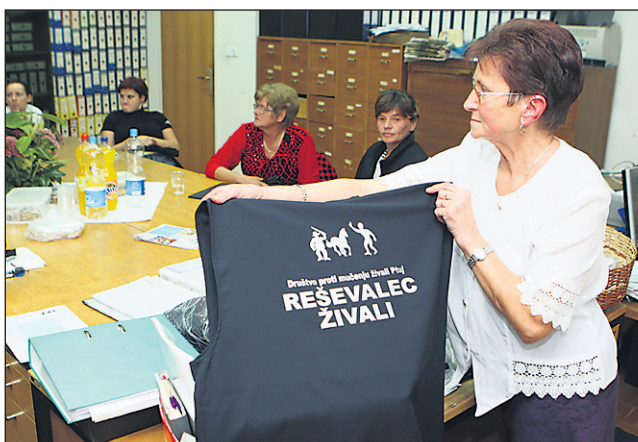
Od prejšnjega tedna ima Društvo proti mučenju živali Ptuj svoje brezrokavnike, da jih bodo na terenu resneje jemali.