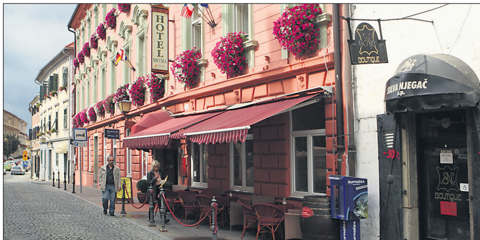
Hotel Mitra je po mnenju Ptujčanov in turistov eden od najlepše urejenih objektov v mestnem jedru.

Izbira najboljših v urejanju okolja je letos prvič potekala na podlagi posebne prijavnice. Dogajanje na Mestnem trgu, ki ga je sicer zmotil dež, je spremljal bogat kulturni program v izvedbi učencev ptujskih osnovnih šol, Glasbene šole Karola Pahorja Ptuj in Pihalnega orkestra Ptuj ter ptujske folklore. Folklorna