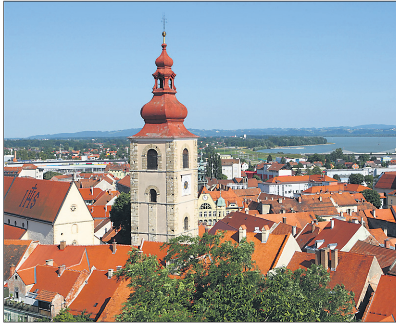
Ptuj je letos „tekmoval“ v kategoriji zdraviliških krajev.

Turistična zveza Slovenije je te dni objavila rezultate oziroma nagradjenec letošnjega projekta Moja dežela - lepa in gostoljubna, ki poteka že več desetletij. Sklepna slovesnost bo 8. oktobra v Celju. V tekmovanju, v