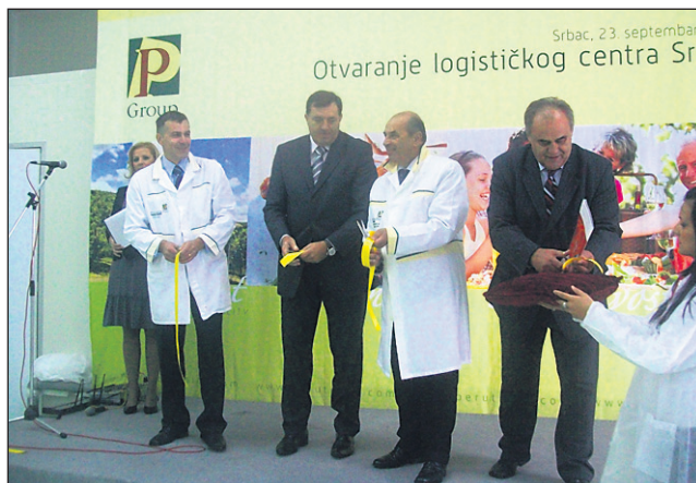
Konec minulega tedna je vodstvo PP v Srbcu uradno odprlo nov logistični center.