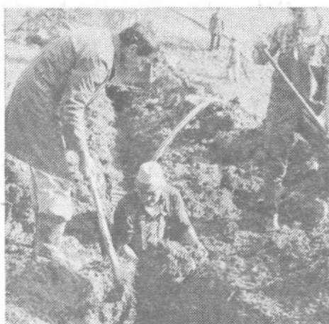
Akcija je obrodila dragoceni sad

V nadaljevanju prireditve so nato nastopili tudi učenci OŠ »Dolomitski odred« Polhov Gradec, ki so se predstavili z izbranimi recitacijami in proznimi deli, sklenili pa so