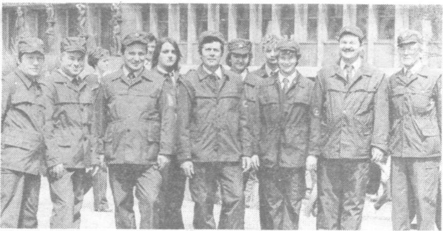
Udeleženci – člani enote civilne zaščite Plutal na osrednji proslavi na Trgu revolucije dne 11. maja 1985.