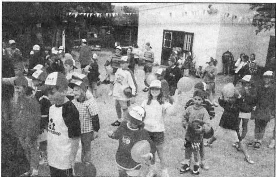
Otroci z balončki pred obednico čakajo na igro