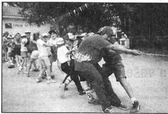
Otroci preizkušajo svoje moči z vlečenjem vrvi

2. januarja smo spet zgodaj vstali in se napotili na celodnevni izlet v Río Quilpo. Tam smo najprej pospravili, kar so drugi onesnažili, medtem pa poiskali primeren