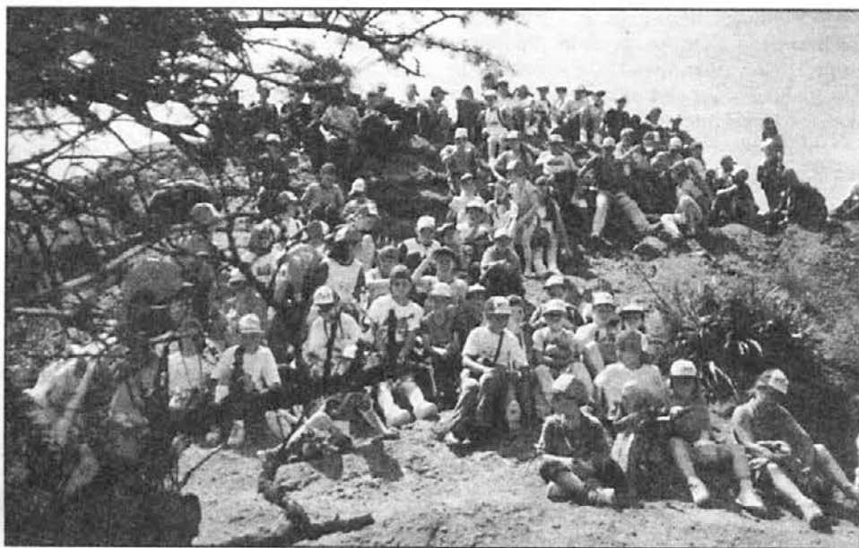
Kolonija na izletu

Prvi omnibus se je oglasil po dveh urah!