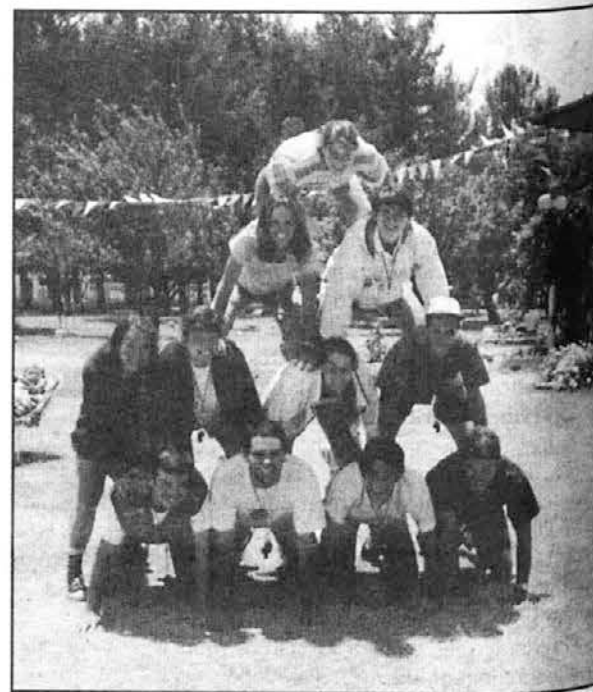
Tudi voditelji imajo svojo zabavo