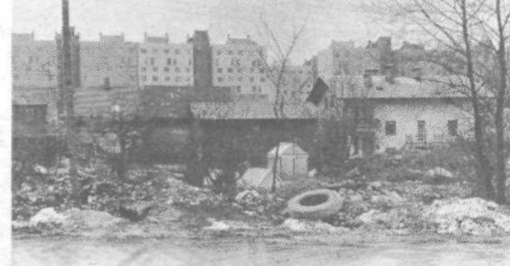
»Vzorno« urejeno je tudi odlagališče smeti v Dravljah, za gostilno Žibert. Tam je mogoče najti tudi nekaj rezervnih delov za kamione, traktorje in druga vozila. Izbira rezervnih delov je pestra, kakor tudi pogled nanje.

OBČANOM LJUBLJANSKIH OBČIN HIŠNIM SVETOM, DELOVNIH ORGANIZACIJAM, DRUŠTVOM, ŠOLAM! Tudi po letošnji zimi kaže naša Ljubljana sliko umazanega mesta. Po ulicah in cestah, parkih in zelenicah, dvoriščih in vrtovih se je nabralo veliko smeti in nesnage. Očistimo torej Ljubljano in iz nje naredimo spet belo mesto! Komunalni delavci bodo postorili vse, kar je treba, na mestnih javnih površinah. Oprali bodo ceste, uredili zelenice in javne parke, zakrpali in pobarvali ceste. Vse ostalo pa bomo morali očistiti sami. Občani, delavci in mladi bomo s tako akcijo, ki bi jo morali občasno ponavljati skozi vse leto, napravili svoje bivanje in delo prijetnejše in boljše. Naj bo to tudi začetek našega boljšega in spoštljivejšega ravnanja z našim okoljem nasploh! Želimo vam uspešno delo za lepo, pomladno podobo našega mesta! ODBOR ZA ČISTO IN ZELENO LJUBLJANO PRI P MK SZDL LJUBLJANA