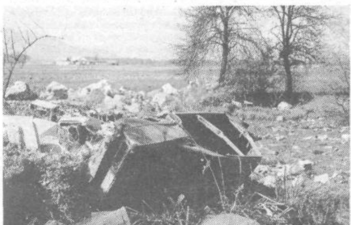
Na detajlu smetišča iz Sela pri Vodica je mogoče videti, da nosijo tja odpadke kleparji, mehaniki in drugi »obrtniki«. Takih smetišč je v Šiški še precej, vendar je omenjeni problematičen predvsem zato, ker je nekoliko nižje proti Ljubljani načrtovano vodno zajetje. Če se bo odlaganje odpadnega olja in druge nesnage še nadaljevalo, potem vodnega zajetja najbrž ne bo. Prepričani pa smo, da v nekdanjem bajerju tudi žab ne bo. Zanesljivo pa bo »prijeten vonj«.

Foto in besedilo: Brane Praznik Akcija »ČISTA IN ZELENA LJUBLJANA«