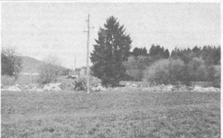
Travnik v Selu pri Vodica je last Emone, smeti pa kranjanov iz okolice. Emone je travnik dala v najem zasebnemu kmetovalcu, ki ga gnoji in kosi ter si hkrati prizadeva, da kranjani ne bi nosili odpadke v jamo sredi travnika, v kateri so nekoč kopalili glino. Dosedanja prizadevanja najemnika, da bi odpravil krajevno smetišče niso dala rezultatov... Morda mu bodo pomagale inšpekcijske službe in sodišča...

Foto in besedilo: Brane Praznik Akcija »ČISTA IN ZELENA LJUBLJANA«