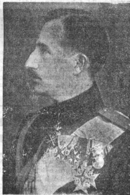
Bolgarski kralj Boris.

V noči od preteklega petka na soboto je doživela Bolgarija nenaden prevrat: