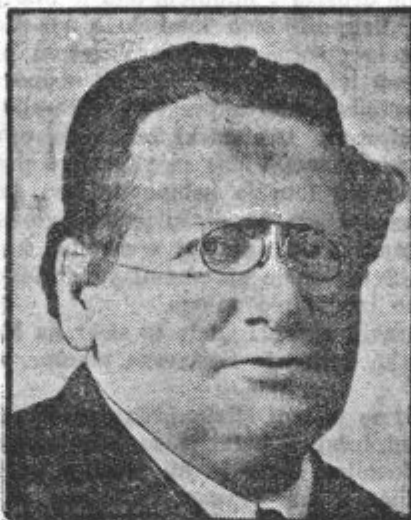
Litvinov, zunanji komisar sovjetske Rusije.

Ruski minister (komisar) za zunanje zadeve se je pretekli teden nenadoma pojavil v Ženevi, kjer se je dolgo posvetoval s francoskim ministrom za zunanje zadeve Barthou-jem. Splošno sodijo, da sta govorila o pogojih, ki bi omogo-