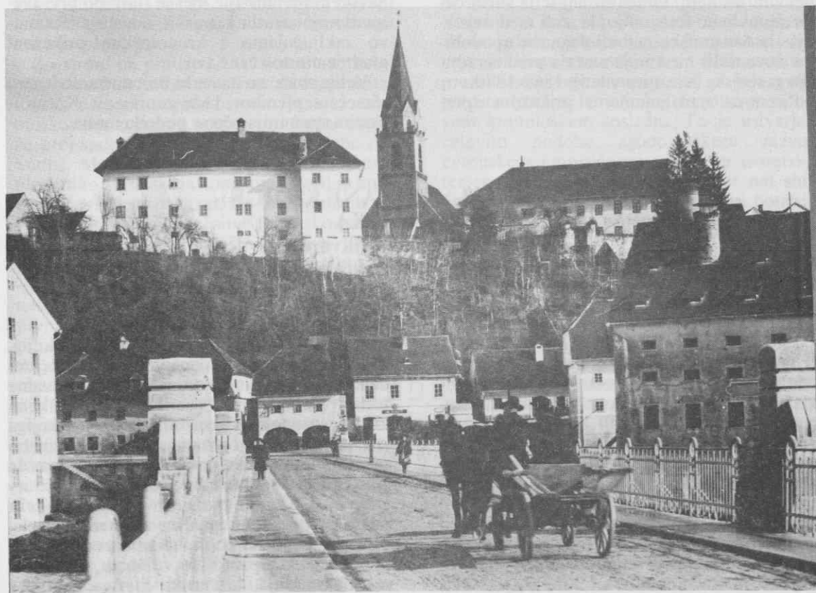
Pogled na most čez Savo v Kranju, fotografija iz časa pred prvo svetovno vojno