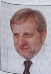
Piše: Gregor Miklic, izvršni sekretar v ZSSS