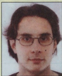
Piše: Jure Snoj, svetovalec ZSSS