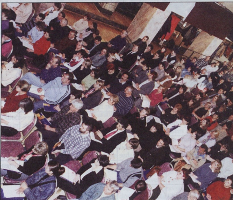
V Festivalni dvorani se je zbralo več kot 200 sindikalnih zaupnikov in predstavnikov svetov delavcev.

komplet! faksa! profesorjev! izpitov! statusa!