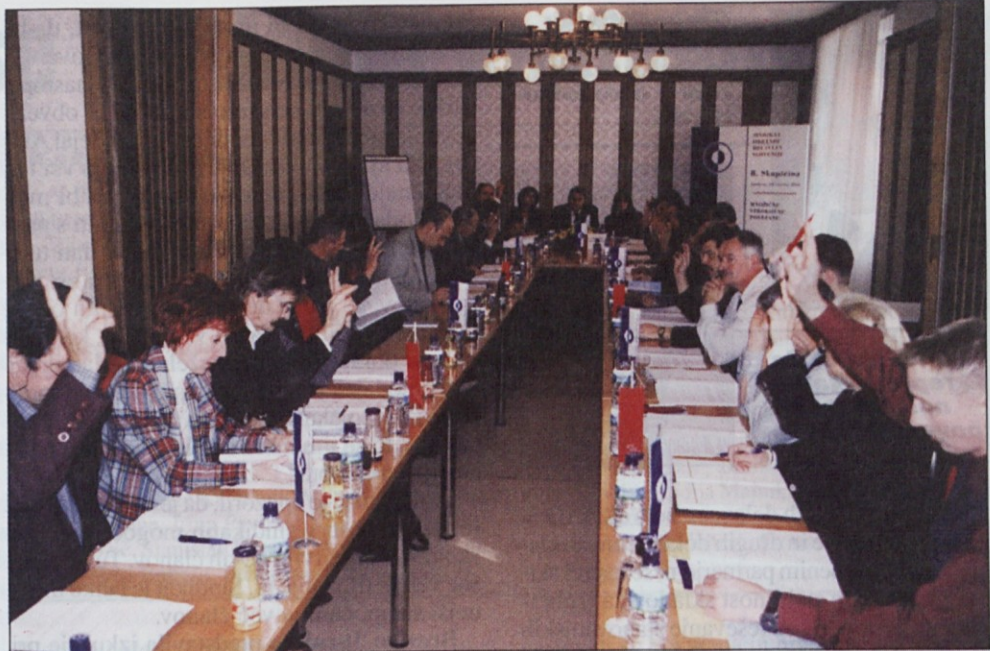
Delegati so poročilo o delu in programske usmeritve sprejeli soglasno.