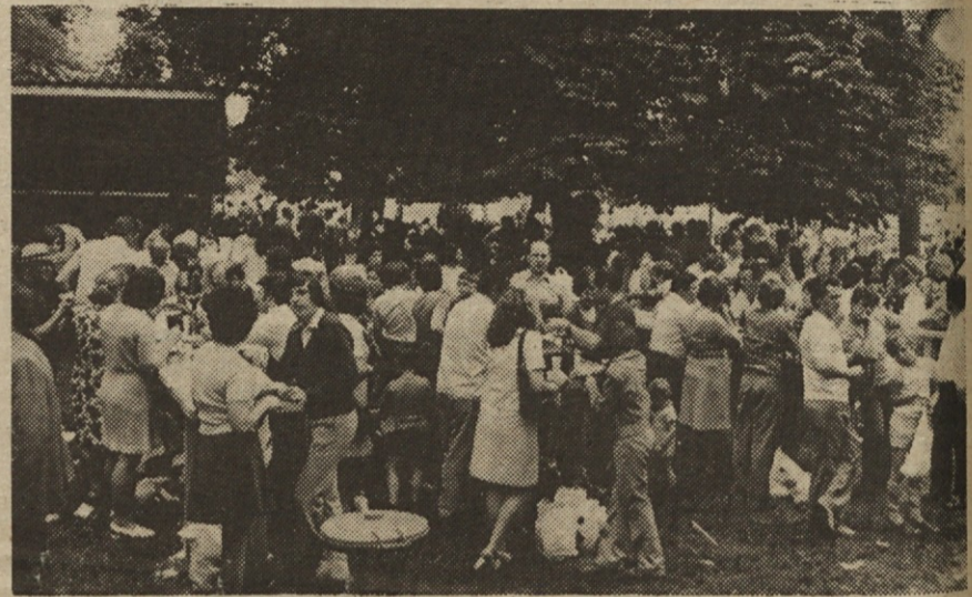
Kljub tolikšni udeležbi Iskrašev je v Mestnem parku v Celju bil dren le ob zasilnih mizah pred številnimi paviljoni, ki so jih pripravili podjetni gostinci.

Menim, da sem po malem obgrizel vse in vsaj za silo izpolnil svojo nalogo. Oceno pač prepuščam bralcem (upam, da ne bodo prestrogi), „z višine“ bo že kanil kak „Žegen“, če morda nisem omenil vsega in tako, kot bi bilo želeli. Vsekakor pa bi storil neodpušljivo napako, če za konec ne bi rekel katere okrog organizacije in organizatorjev proslave. Čeprav je za časa priprav kazalo, da ne bo vse tako kot treba, se je vendarle izkazalo, da prizadevanja organizatorjev niso bila zaman in je dobra organizacija tudi precej prispevala, da smo iz Celja odhajali z dobrimi vtisi in zadovoljnimi, da smo v prijetnem mestu, v prijetnem okolju in veselem vrvežu dostojno proslavili naš vsakoletni praznik – C –