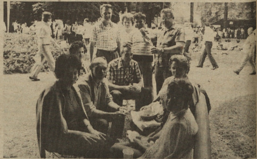
„Nikamor brez posnetka!“, mi je zastavila pot skupina Kranjčanov, ki se je z golažem „utaborila“ v senci pod košatim drevesom. Treba je bilo „knipsniti“ in pika!