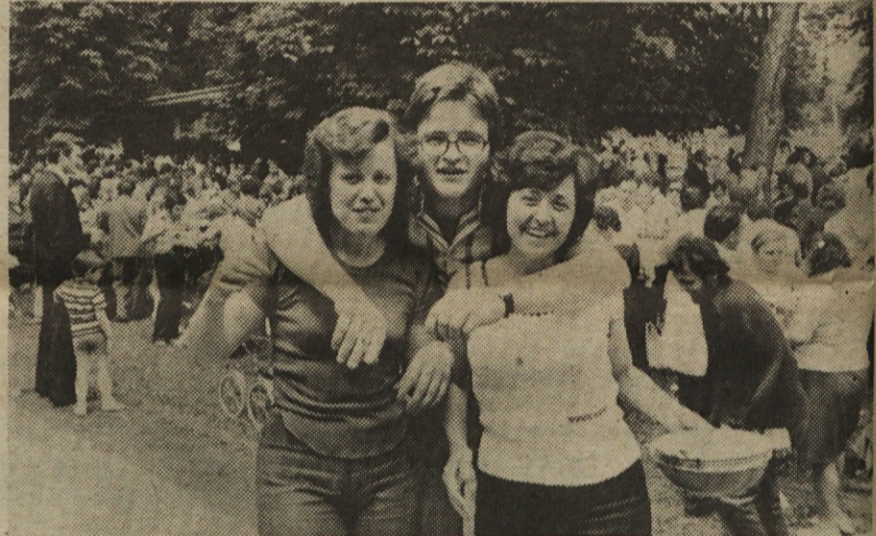
Slika sama dovolj zgovorno priča, da so praznovanje v Celju prijetno preživeli. Seveda pa ne samo ti trije. Dobre volje in veselja ni primanjkovalo nikjer in nikomur.