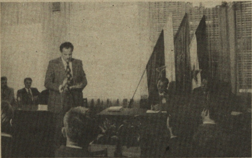
Predsednik gospodarske zbornice SR Slovenije govori ob zaključku slavnostnega podpisa sporazuma ISKRA - GORENJE.

Povezava, ki ste jo zasnovali in ki bo danes dobila svojo dokončno podobo je pomembna tudi za nadaljnje povezave v širšem jugoslovanskem prostoru, pa končno tudi zunaj njega. Dejanje, ki ga danes zaključujete, je šele prva stopnja v prizadevanjih tako velikega delovnega kolektiva, tako sposobnega po svojih kadrskih in tako ambicioznega po svojih programih