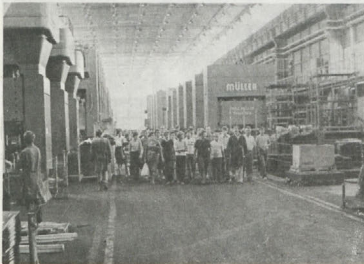
Šolarji na obisku v naši DO.

GOSPODARSKI VESTNIK Št.: 29, 30. 7. 1980