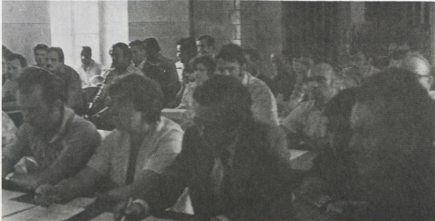
Seja delavskega sveta.