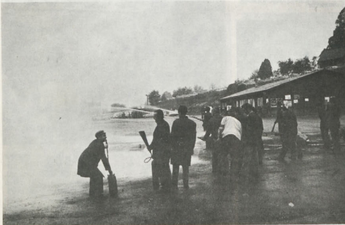
Gašenje požara z motomo črpalko v tovarni avtomobilov – posnetek je iz lanske uspele akcije NNNP.

– Pri popolnjevanju enot civilne zaščite z novimi člani posvetiti pozornost, da se v te predloge za razpored tiste, ki že imajo določene sposobnosti za opravljanje nalog v civilni zaščiti in stanujejo bližje Novemu mestu. Izvršiti analizo dosežaj razporejenih in na podlagi ugotovljenega stanja in števila nerazporejenih delavcev, predložiti sekretariatu za ljudsko obrambo občine nove kadre, ki bodo okrepili strokovnost in tudi sposobnost za opravljanje nalog s področja civilne zaščite.