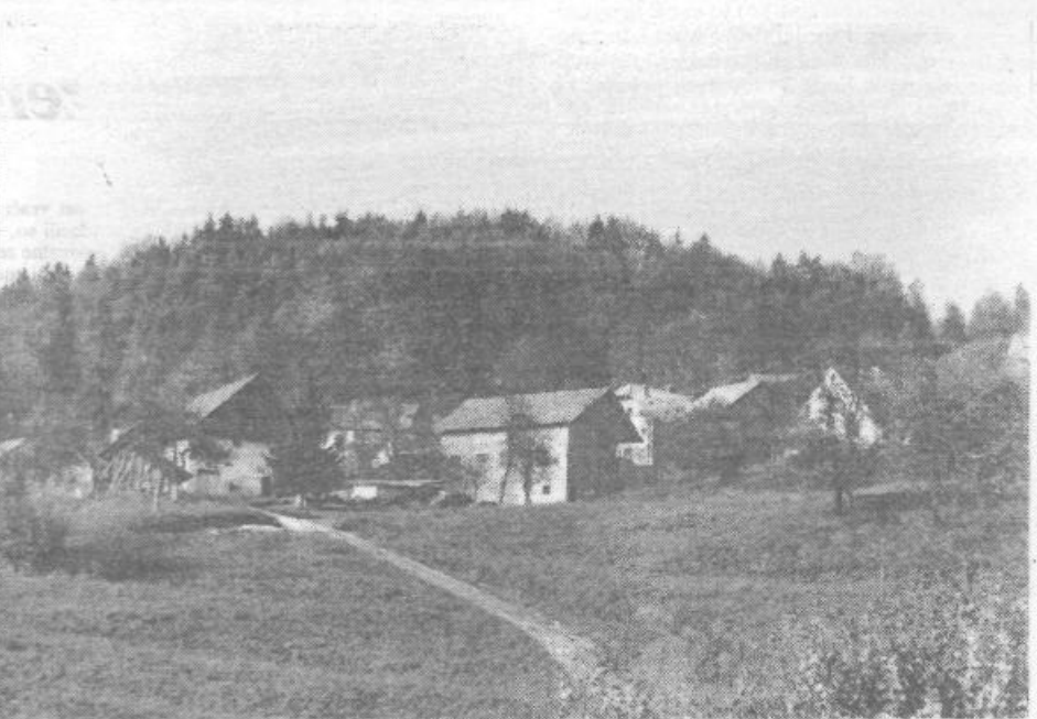
Babnogorska panorama: z asfaltom bodo prišli tudi izletniki

Nuša Gašper, 5. a OŠ Primoža Trubarja V. Lašče