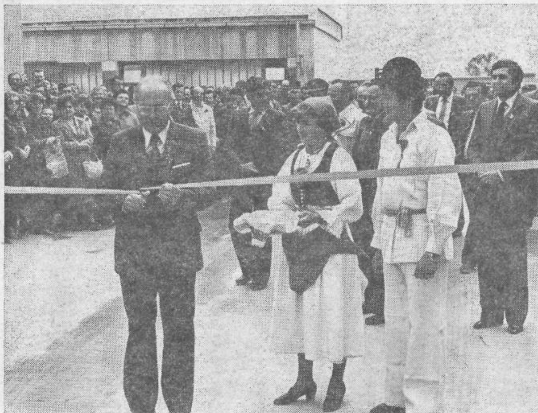
V Križevcih so odprli nove proizvodne prostore Donitove temeljne organizacije Plator, ki so jo zgradili s skupnimi močmi vseh Donitovih temeljnih organizacij