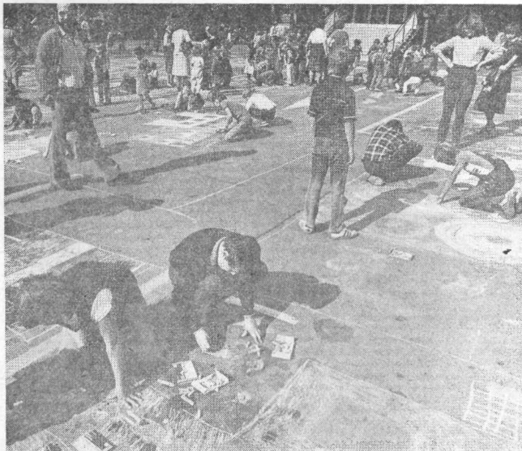
Cicibani in pionirji Šiške so Teden otroka zaključili z risanjem na ploščadi pred skupščinsko stavbo na temo »TRETJI SAMOPRISPEVEK NAM ZAGOTAVLJA LEPŠI JUTRI«