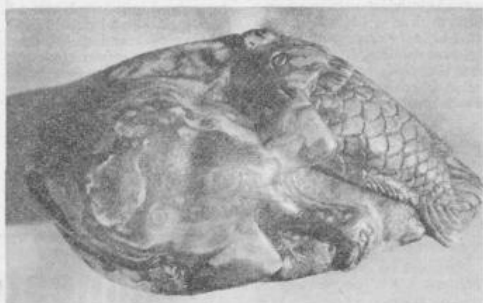
Pladenj iz jantarja, na njem riba in gos.

Kot smo vas že seznanili v prejšnji številki, so arheologi na gradbišču nove obvoznice na robu Natašine poti v Ptuj odkrili osem rimskih grobov. Grobovi so žgani in ležijo ob cesti, ki je nekdanj vodila proti Savariji. Našli so nekaj novcev, kosov lončenine, majhnih posodic solznic iz stekla. Najdbe, ki jih skorajda lahko najdemo v Ptuj in bližnji okolici, če le lopato zasadiš dovolj globoko, kot radi pravimo Ptujčani. In vendar smo vsakokrat znova presenečeni; tako so bili arheologi tudi tokrat, ko so odprli grob številka sedem in v njem našli čudovit nakit iz jantarja. Dva prstana, eden s figuro ležečega psa, drugi s figuro psa in otroka, ki se igra. Izredno zanimiv je pladenj, na katerem je