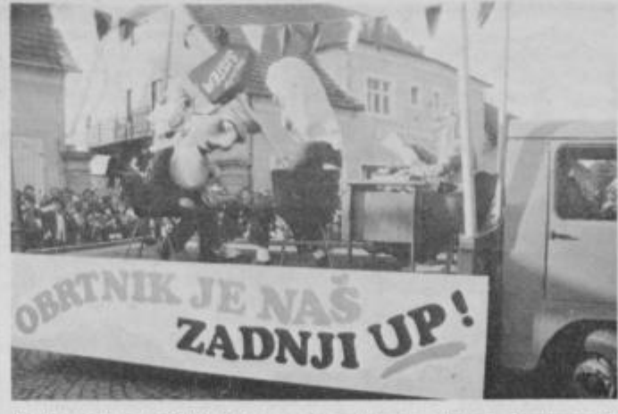
Obrotno združenje Ptuj je letos prvič sodelovalo s skupino, in kot se je pokazalo, jim je uspelo: vžgali so s svojo resnico, ki pa je tudi družbena.