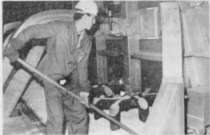
Prvi aluminij v novi elektrolizi C je nastal v peči z oznako 201.

To pa pomeni tudi pričetek proizvodnje aluminija v tej peči, ki naj bi neprekinjeno delovala vse do konca svoje življenjske dobe leta 1994. Naslednji dan so priključili že drugo peč in vsak dan naslednjo, tako da je danes priključenih že 8 peči. Priklapljanje bodo nadaljevali s takšno dinamiko, da naj bi do konca aprila delalo vseh 80 peči v novi elektrolizi. V maju naj bi proizvodnjo aluminija optimirali in predvidevajo, da naj bi v začetku junija dosegli že celotno proizvodno zmogljivost elektroze C; ta pa je 35.000 ton aluminija. To pomeni, da v drugi polovici leta v TGA ne bodo razpolagali le s 45.000 tonami proizvodnih zmogljivosti, ampak z 80.000 tonami.