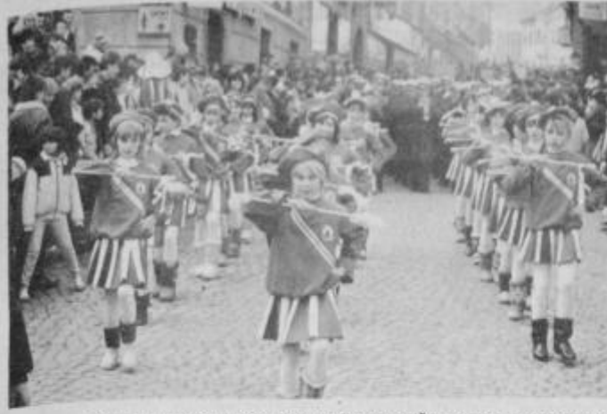
Letos so v Ptuj nastopile najmlajše mažoretke. Četudi so bile prisrčne, se je nekaterim stožilo po malo večjih... Morda jih bomo Ptujčani lahko občudovali prihodnje leto? Se najbolje bi bilo, da bi dobili svoje!