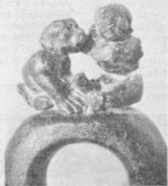
Jantarjev prstan z otrokom in psom.