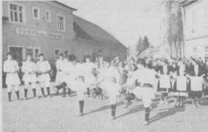
Iz Bitole so že osmič prišli vasilčarski babari.

Za organizacijski odbor se z nedeljsko prireditvijo delo ni končalo. Že v prihodnjih dneh bo izdelal podrobno poročilo z akcijskim programom za 29. kurentovanje. V bodoče naj bi pri-