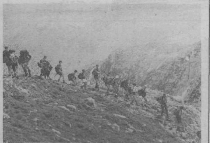
Del stotnje Saturnužanov ob sestopanju s Krna

Še številnejše pripombe pa so bile k prostorskemu načrtu za Zg. Kašelj MS 8/5, ki je bil razgrnjen do 15. t. m. na občini in v KS. Prevladovale so pripombe na sedanjo in na predlagano prometno ureditev Kašlja ter Vevč, ki je osrednji problem v tem 90 odstotno pozidanem prostoru. Osrednji del Kašlja je nujno prometno boljše odpreti in povezati z Zaloško cesto mimo Petrolovih skladišč, na Vevškem delu pa urediti prometnico z mostom. S. G.