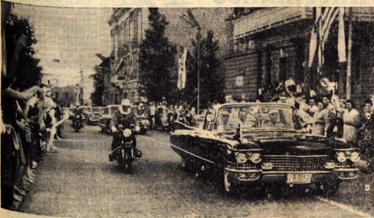
KRANJ, 25. junija — V četrtek, nekaj pred 19. uro, so številni Kranjčani pozdravljali predsednika Liberije Tubmana in našega predsednika Tita, ki sta z Brionov potovala na Brdo. Predsednika sta se z Gorenjske vračala večeraj zjutraj