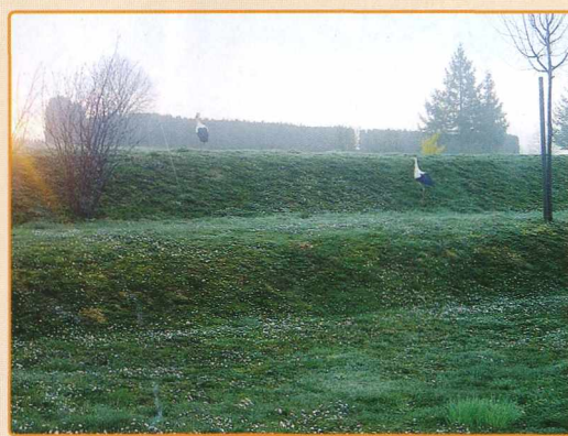
ŠTORKLJI NAZNANJATA POMLAD A GÓLYÁK A TAVASZ ÉRKEZÉSÉT HIRDETIK