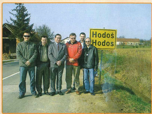
PREDSTAVNIKI POBRATENE OBČINE IZ SLOVAŠKEGA HODOSA A FELVIDÉKI, HODOSI TESTVÉRKÖZSÉGÜNK KÜLDÖTTSEGE