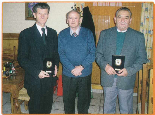
PREDSEDNIK GASILKE ZVEZE RS PODELIL PRIZNANJA ZA SODELOVANJE A SZLOVÉN TŰZOLTÓSZÖVETSÉG ELNÖKE KIOSZTJA AZ ELISMERÉSEKET