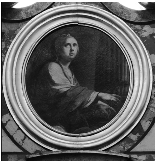
Valentin Metzinger: Sv. Cecilija, Ljubljana, ž. c. sv. Trojice, 1749.

Kako si je umetnik podobo sv. Cecilije zamislil, ne vemo, ker slika (po dosedanjih podatkih) ni