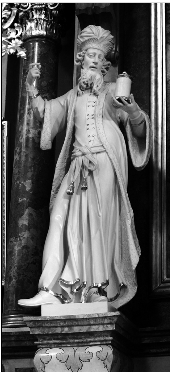
Urban Gaber: Sv. Kozma, Ljubljana, ž. c. sv. Trojice, sredina 18. stol.