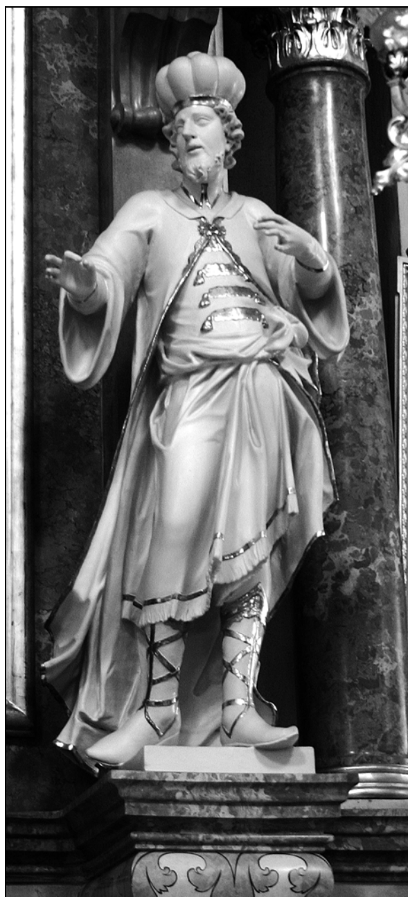
Urban Gaber: Sv. Damijan, Ljubljana, ž. c. sv. Trojice, sredina 18. stol.

je njuna neobtežena duša tudi hitreje dvigala v kontemplaciji nebeških reči. Govornik se ni hotel posebej zadržati ob slogi obeh bratov, ki sta delala, kot da bi bila enega duha in mišljenja, ampak je prešel na njun rod. Poslušalcem je zastavil vprašanje, zakaj verjamejo, da sta se odevala v vojaško ogrinjalo, obšito s škrlatom, ali v cesarski oz. kraljevski purpurni plašč, saj vendar te časti predstavljajo le kupljivo in ničevo slavo. Sveta dvojčka pa slavo nista pridobila po rodu, ampak po goreči ljubezni, kreposti in dejanjih, ki so jima prinesli škrlat. Nepremagljiva ju-