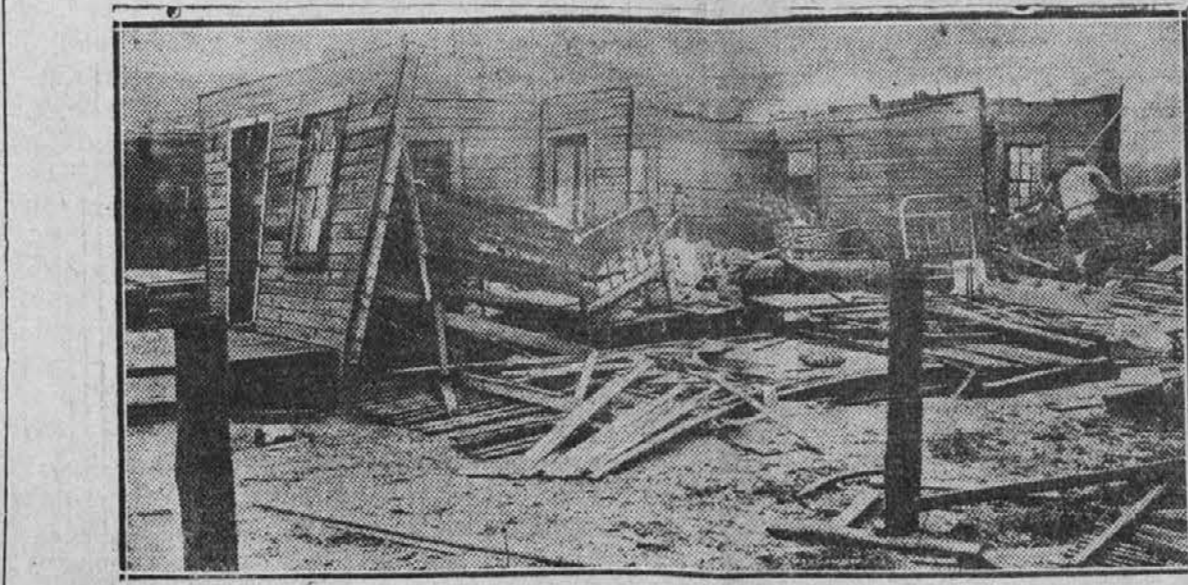
Pogled na neko poslopje, kakoršnega je zapustil orkan, kateri je nedavno razsajal nad Pensacola, Fla. V viharju se bilo poškodovanih število oseb, mnogo družin je ostalo brez strehe in povzročena škoda se računa na $100,000.