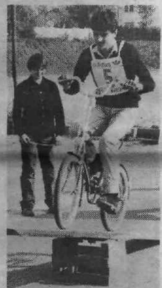
Sicer pa je spretnostna vožnja pokazala, da nekateri prav zares obvladajo ponj kolesa, saj so spretno krmarili med keglij, prepeljali brv, dokazovali obvladovanje počasne vožnje, zapeljali skozi predor in prenašali žogico z enega mesta na drugo. Za to vožnjo je bilo treba seveda precej treninga, znanje pa bo verjetno osnovnošolcem koristilo tudi v vsakdanjem prometnem labirintu.

Konec dober, vse dobro, bi lahko zapisali, saj so na koncu vendarle uspeli izračunati rezultate, razdeliti medalje in pokale, čeprav lahko dodamo, da bi bilo treba tekmovalje, ki zahteva veliko predpriprav udeležencev, na katerem vsakdo vloga vse svoje znanje in moči, prav zaradi pionirjev in pionirk, ki tekmujejo, bolje organizirati.