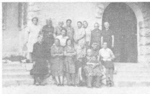
Za spomin s prijetnega letovanja

Vendar pa na Srednjem vrhu še zdaleč ni bilo dolgčas, za kar so vsekakor poskrbeli pionirji in pionirke, učenci šišenskih šol, ki so delali družbo starejšim občanom. Pa so se kar dobro razumeli, saj so otroci zadnji večer svojim starim prijateljem celo pripravili prijeten program recitacij in petja, ki bo vsem ostal še dolgo v spominu. Ob prisrčnih interpretacijah otrok so se marsikomu orosile oči in ob koncu so vsi želeli, da bi se še kdaj srečali. »Radi smo vas imeli in pogrešali vas bomo«, je vzkliknila neka deklica v slovo.